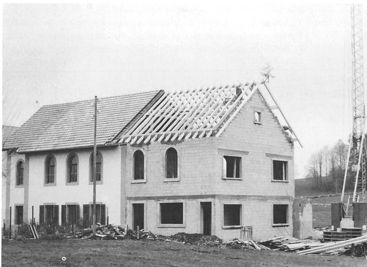
Agrandissement de la chapelle des Bulles.

chapelle, à la fin de l'année 1969, amènent des changements. On décide la rénovation de la salle du rez-de-chaussée (chambre), avec suppression du baptistère 6 dans le plancher, et on réétudie le fameux projet d'agrandissement du bâtiment qui avait été refusé pour les festivités qui venaient de se terminer! La chapelle était décidément trop petite.