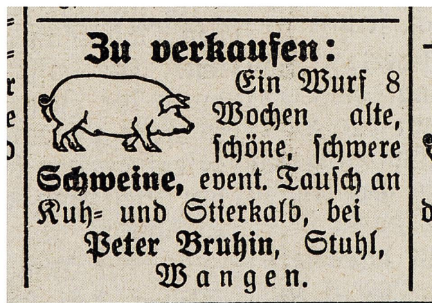
March-Anzeiger vom 29.1.1932