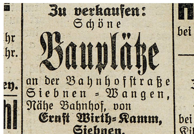
March-Anzeiger vom 18.3.1930