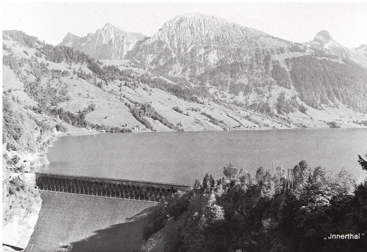
Stausee und Staumauer Schräh nach der Fertigstellung 1925: links der Blick auf neu Innerthal, im Hintergrund (von links) Tierberg, Bockmattli, Schwarzenegg, Schiberg, Zindelspitz und Lachenstock.

Doch selbst in Innerthal, der betroffenen Gemeinde, regte sich, nach den zwei gescheiterten Rekursen vor Bundesgericht, kein einheitlicher Widerstand. Grosse Teile der Innerthaler sahen gar eine Chance darin ihre Ländereien der AG Kraftwerk Wägital zu verkaufen. Zudem waren viele nicht bereit, Landflächen für die Umsetzung eines gross-angelegten Umsiedlungsprojekts abzutreten. Aufgrund