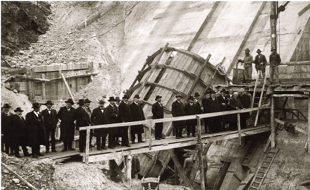
An der feierlichen Einsegnung der Erosionsrinne (Staumauer im Schräh) nahmen neben Arbeitern auch Behördenvertreter teil (31. Oktober 1923).

greifen und eine Lösung zu erarbeiten. So muss auch ein neues Produkt, bevor es auf den Markt kommt, im Labor diverse Tests und Untersuchungen überstehen.