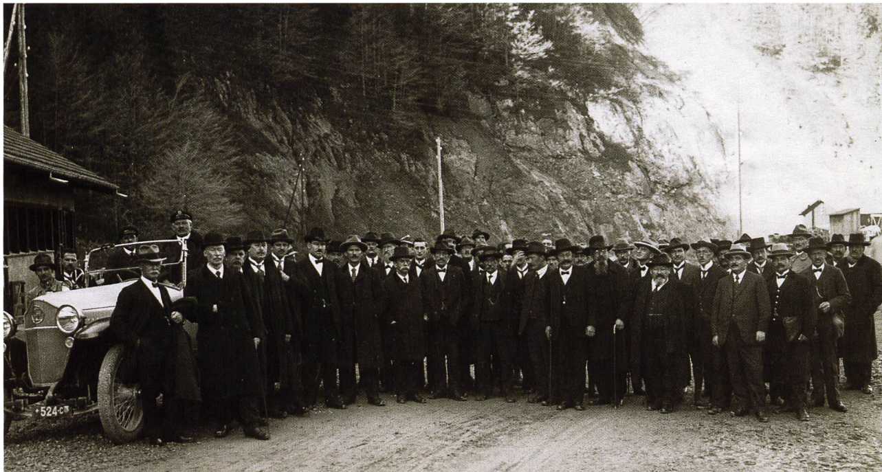
Feierlich posieren zahlreiche Beteiligte nach der Einsegnung der Erosionsrinne (Staumauer Schräh) am 31. Oktober 1923.

Der Beschluss, das kleine Bauerndorf Innerthal einer grossen Energieanlage zu opfern, löste erstaunlicherweise kaum Entrüstung und Widerstandsparen aus. Die Mehrheit der Schweizer Bevölkerung war davon überzeugt, dass eine autarke Energieversorgung bedeutungsvoller war als die Erhaltung von 32 Bauernhöfen in Innerthal. 16