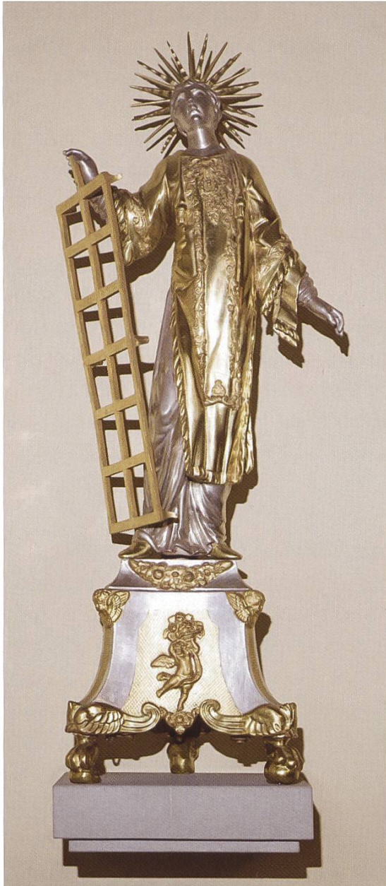
Abb. 1: Der Reichenburger Kirchenpatron St. Laurentius.

Barocke Statue (Holz, gold- und silbergefasst, um 1750), in die heutige Pfarrkirche übernommen.