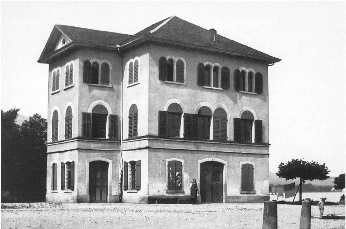
Im Alten Zeughaus (hier um 1900) wurden 1928 im ersten Stock zwei Schulzimmer für die Sekundarschule eingerichtet.

7. Mai 1910 wurde von der Antwort der Gemeinde Lachen Kenntnis genommen. Die Gemeinde Lachen habe die «Schulumbaute in Angriff genommen...» In Traktandum 6 steht wörtlich: «Hegner (Bezirksrat) kann nur wünschen, dass die Gemeinde Lachen einmal ihren vertraglichen Verpflichtungen offen Ernstes nachkomme...»