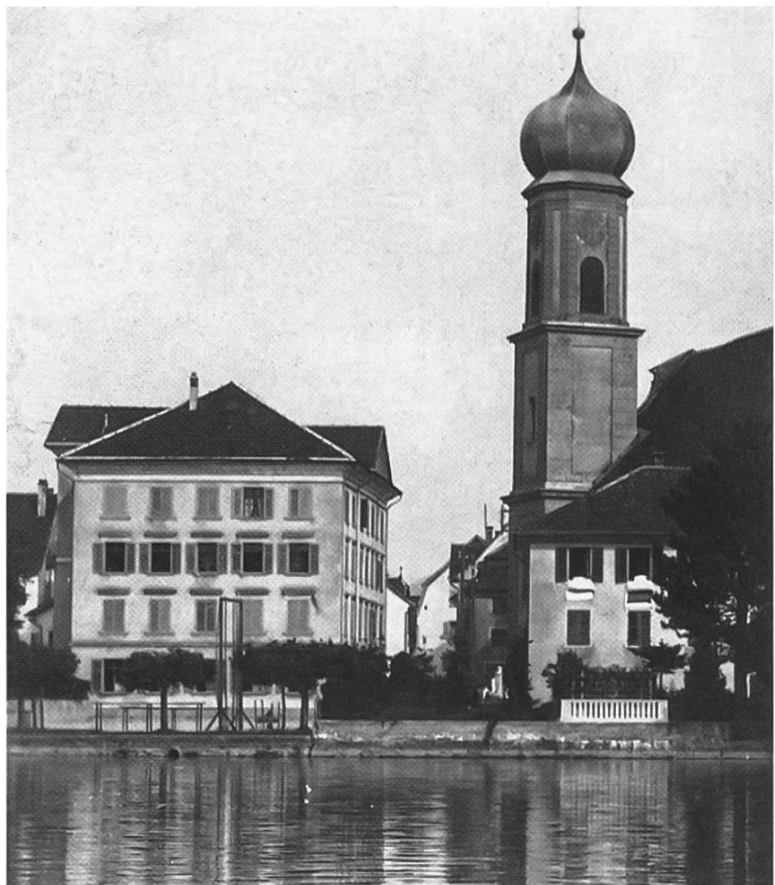
Das Alte Schulhaus neben der Kirche, ca. 1935. Auf dem Platz stehen noch die Turngeräte für die Schüler.

In dieses Schulhaus kamen 1853 auch die ersten beiden Klassen der neu gegründeten Knaben-Sekundarschule. 1898 teilte der Gemeinderat Lachen mit, dass er «gezwungen sei, eine Lehrerwohnung zu Schulzimmern umzuwandeln und wünscht von der in Ziff. 6 des Vertrages vom 1. Okt. 1852» entbunden zu werden. Er offerierte dafür eine alljährliche Wohnungsentschädigung von 250 Franken.