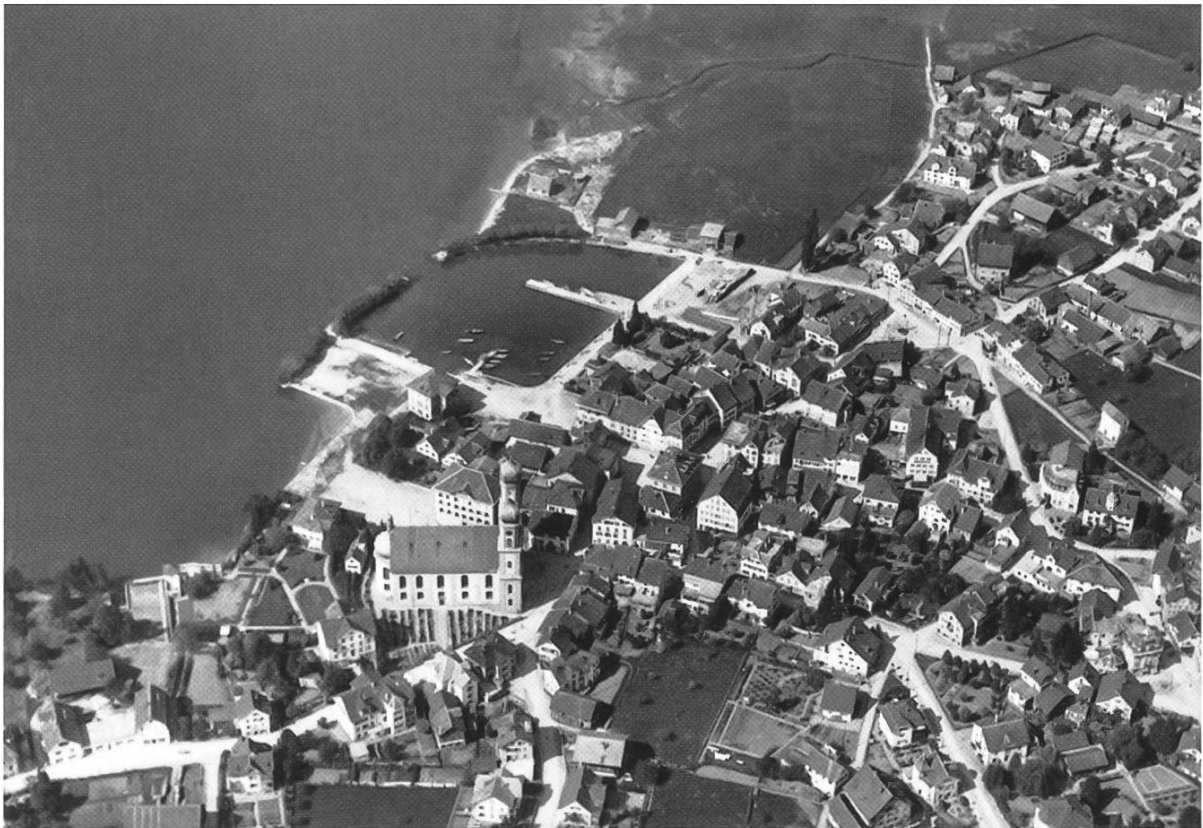
Luftbild von Lachen vor 1920. Da wo heute das Schulhaus am Park steht, war noch sumpfiges Gelände.

Der starke Anstieg der Schülerzahl – in den 105 Jahren seit der Gründung der Bezirksschule hatte sich diese vervierfacht – machten diesen Neubau notwendig. Nebst der attraktiven Lage direkt an den Ufern des Zürichsees bestach der Neubau durch eine moderne Architektur und grosszügige Unterrichtsräume. Erstmals verfügte nun die Sekundarschule über ein spezielles Naturlehrzimmer, eine Werkstatt, einen Singsaal und eine moderne Küche. Das neue Sekundarschulhaus befand sich von Beginn weg im Besitz der Gemeinde Lachen. Der Bezirk March steuerte allerdings 55% der Erstellungskosten bei. In einem zwischen der Gemeinde Lachen und dem Bezirk March geschlossenen Vertrag wurden die Nutzungsverhältnisse festgehalten. An anderer Stelle wird noch von diesem speziellen Vertrag die Rede sein. Der Sekundarschule (und den in den 60er-Jahren eingeführten Abschlussklassen – heute Realschule) genügten anfänglich die Räume des nördlichen Hauptbaues. Im Südtrakt waren Primarklassen einquartiert.