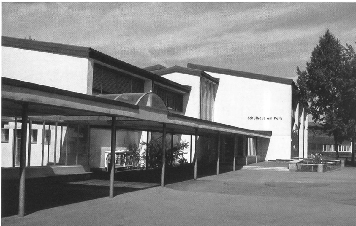
Das heutige Schulhaus am Park, 1958 als Sekundarschulhaus eingeweiht, 1982 und 1999 erweitert.

Mittelpunktschule deshalb nicht mehr so dringend notwendig war, wurde das Projekt von der Planungskommission Ende 1974 auf Eis gelegt, bis man in den Jahren 1978/79 die Notwendigkeit von zusätzlichen Räumlichkeiten für die Sekundarschule erkannte.