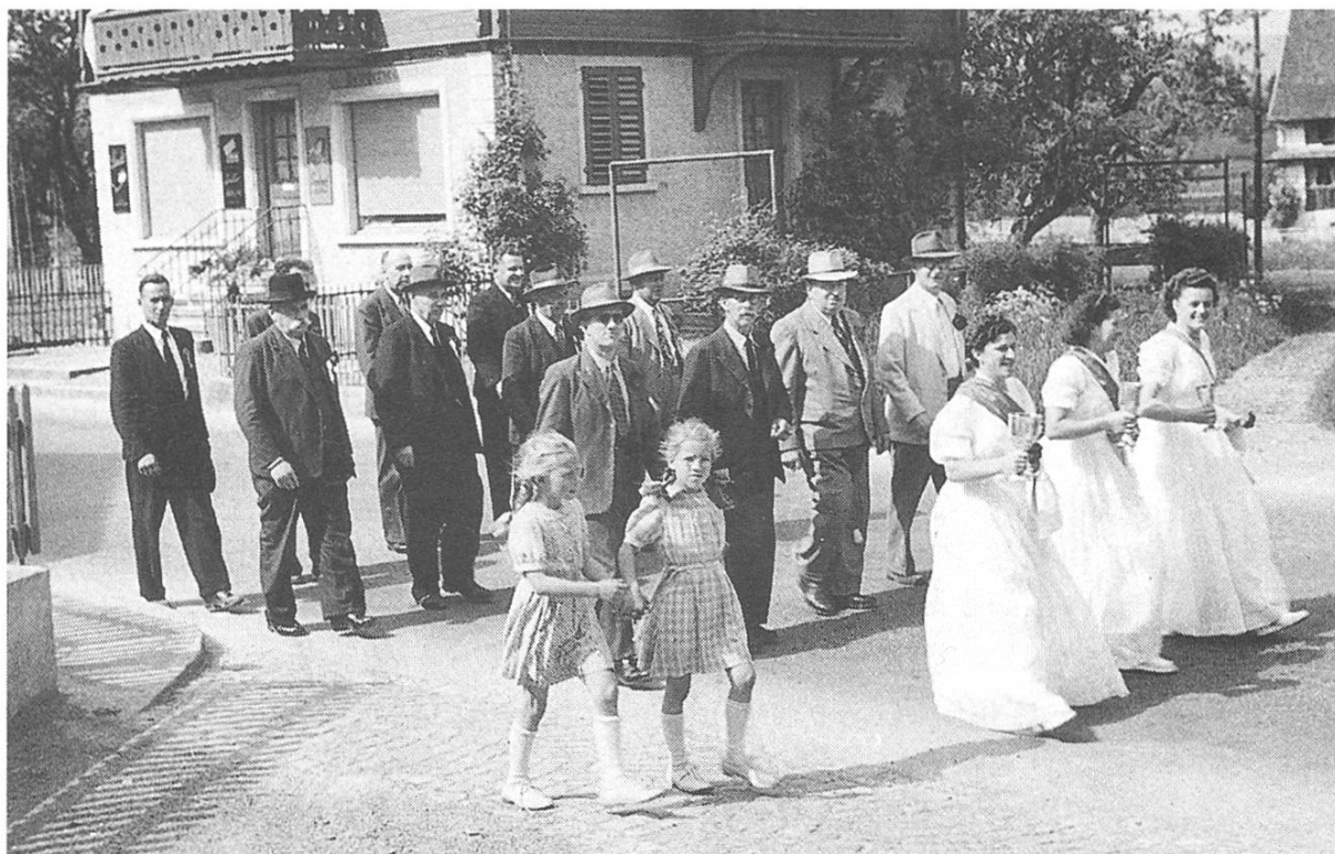
Die Herren Ehrengäste und der Bezirksvorstand

Durchgeführt wird dieses Bezirkswettschiessen, begünstigt von schönstem Wetter, am 20. und 21. Mai auf dem Schiessplatz «Chällen». Schon am ersten Schiesstag herrscht Hochbetrieb und manch gutes Resultat zeugt von edler Schiesskunst oder auch vielleicht von zufälligem Glück. Der obligatorische Festtag ist der 21. Mai. Schon früh am Morgen krachen die Gewehrsalven und das Kräftemessen nimmt seinen Fortgang. Geschossen wird nebst dem Sektionsstich (10 Schuss Scheibe A 10) auch ein Jubiläumsstich (5 Schuss Scheibe A 10). Zur festgelegten Zeit wird der Schiessbetrieb unterbrochen, um auch mitten im Wettkampf unserm Allerhöchsten zu dienen. Umrahmt mit kirchlichen und vaterländischen Liedern, begleitet von der Harmoniemusik Schübelbach-Buttikon, wird ein feierlicher Feldgottesdienst abgehalten, dem eine grosse Menschenmenge beiwohnt. In einer fesselnden Ansprache des hochwürdigen Paters über die Weihe und Heiligkeit des Gottesdienstes begeistert dieser die Anwesenden für Gott und Vaterland und das Ideal des Sportes, was allgemein einen tiefen Eindruck hinterlässt.