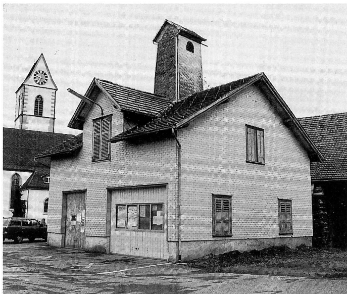
Das erste Spritzenhaus aus den frühen 1920er Jahren.