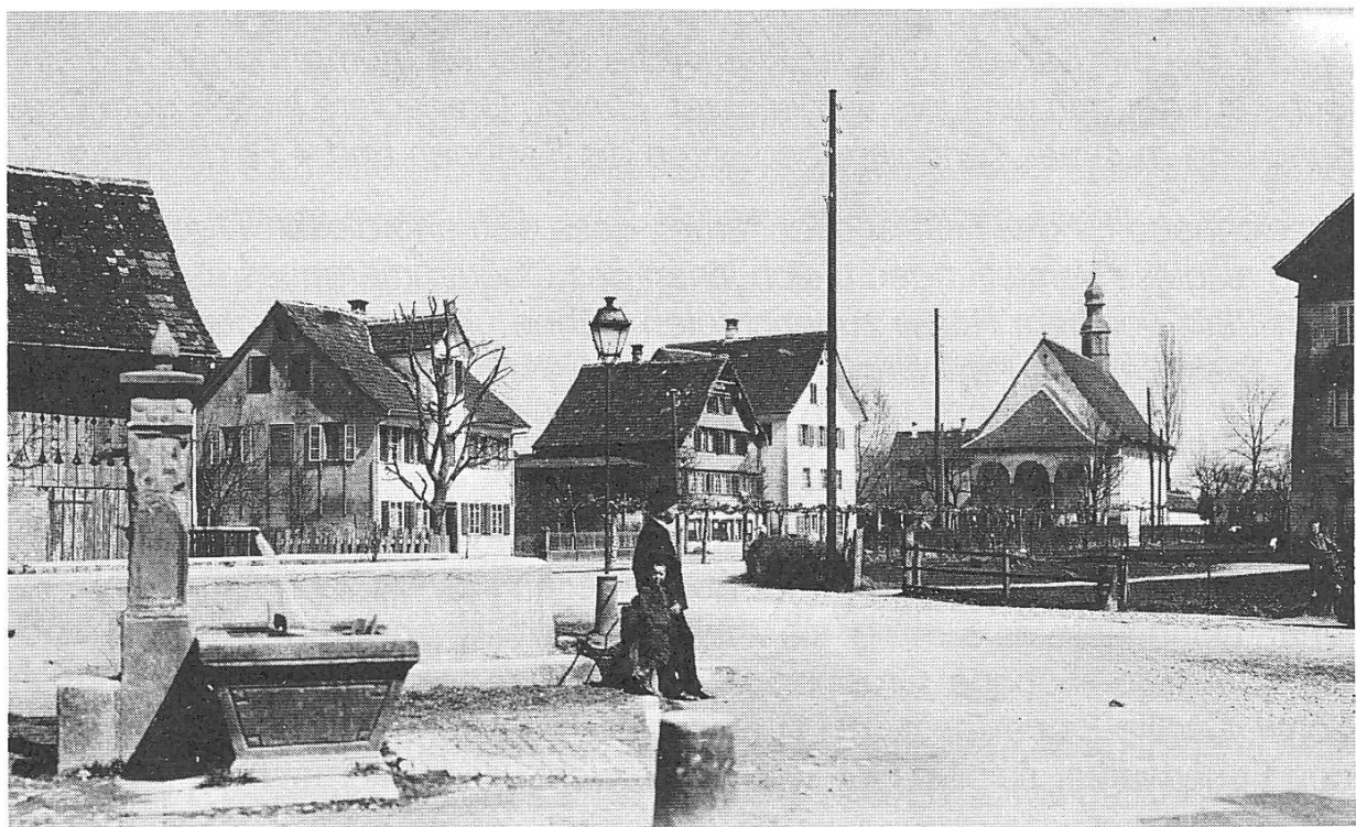
Kapellstrasse um 1900, Postkarte.