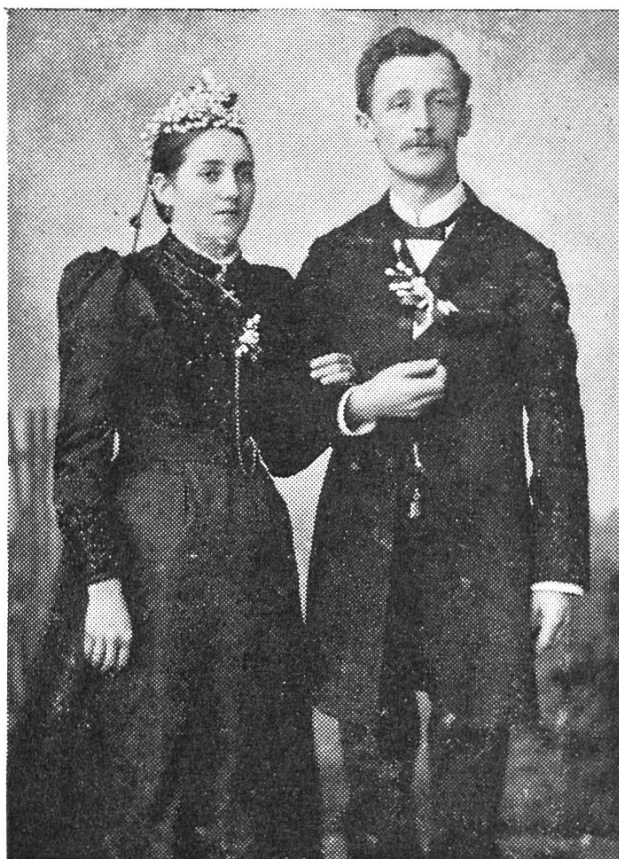
Das Hochzeitspaar Spiess in zeitgemässer Kleidung.

in die Rechnungsprüfungs-Kommission der Kantonalbank gewählt, 1916 rückte er zum Bankrat vor. Ausserdem war er in einer Reihe anderer kantonsrätlicher Kommissionen tätig. Als Mitglied der Seminardirektion kam er mit den jungen Lehramtskandidaten wieder in nähere Fühlung, dann war er Präsident der Staatswirtschaftskommission und wurde 1921 Vizepräsident und 1922 Präsident des Kantonsrates.