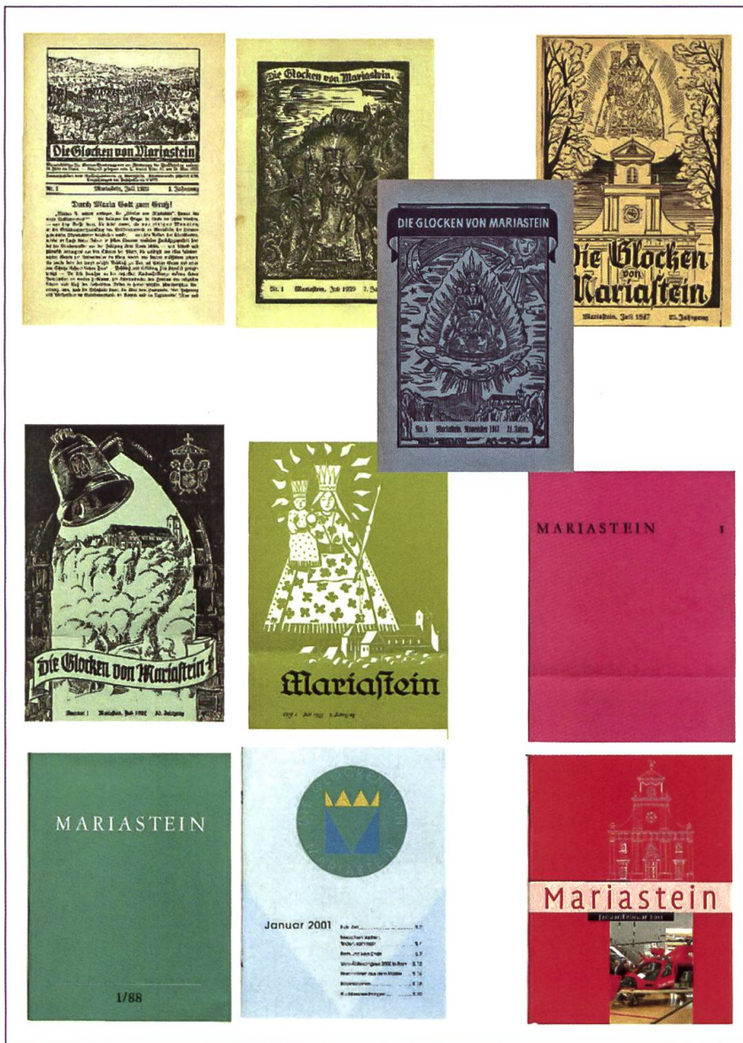
100 Jahre Zeitschrift «Maria-stein»: Ständig im Wandel, wurden die «Glocken» für Wallfahrt und Kloster zum unentbehrlichen Medium.

Veranstaltungen (Liturgie, Kultur, Bildung) werden eigene Prospekte (sog. Flyer) und Programme aufgelegt (Vorhalle zur Basilika, Pforte, Klosterladen Pilgerlaube, Klosterhotel Kreuz, Restaurant Post).