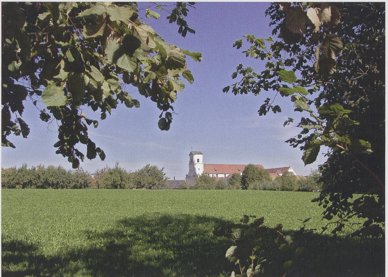
Sommer in Mariastein: Klostergarten.