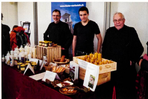
Der Stand des Klosters Mariastein, 2019.

Der Anlass ist öffentlich. Das Zertifikat ist obligatorisch.