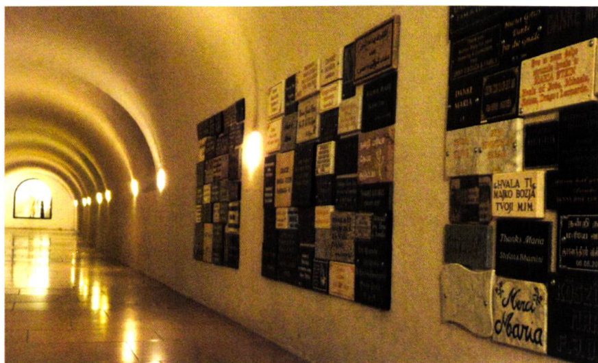
Zahlreiche Votivtafeln im Gang zur Gnadenkapelle.

Eigenartig ist, dass die Dankbaren ihren Namen, wenn überhaupt, dann meist nur mit Initialen angeben. Es kommt also nicht darauf an, wer man ist, Maria hilft allen. Nicht nur das rational Eindeutige fällt weg, auch die Personen und ihre Individualität spielen hier keine Rolle mehr. Wer den Gang entlanggeht, kann seine eigenen Sor-