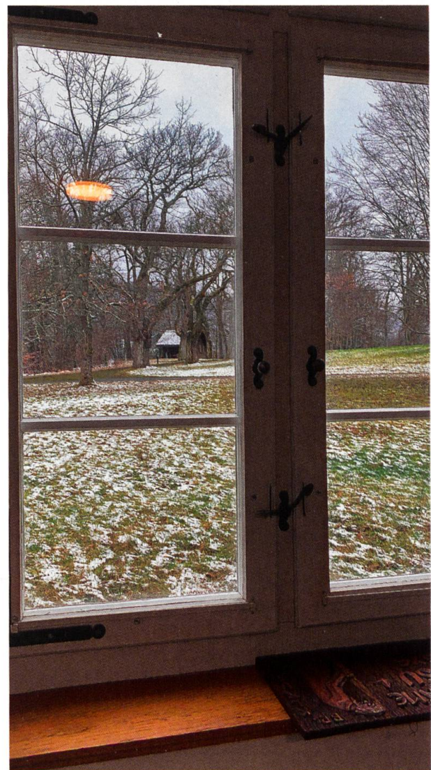
Blick aus einem der verlegten Büros in die Klosterallee.

Auch die fehlenden Gäste sind ein Verlust (nicht nur finanziell), gehören sie doch in einem Benediktinerkloster wesentlich dazu.