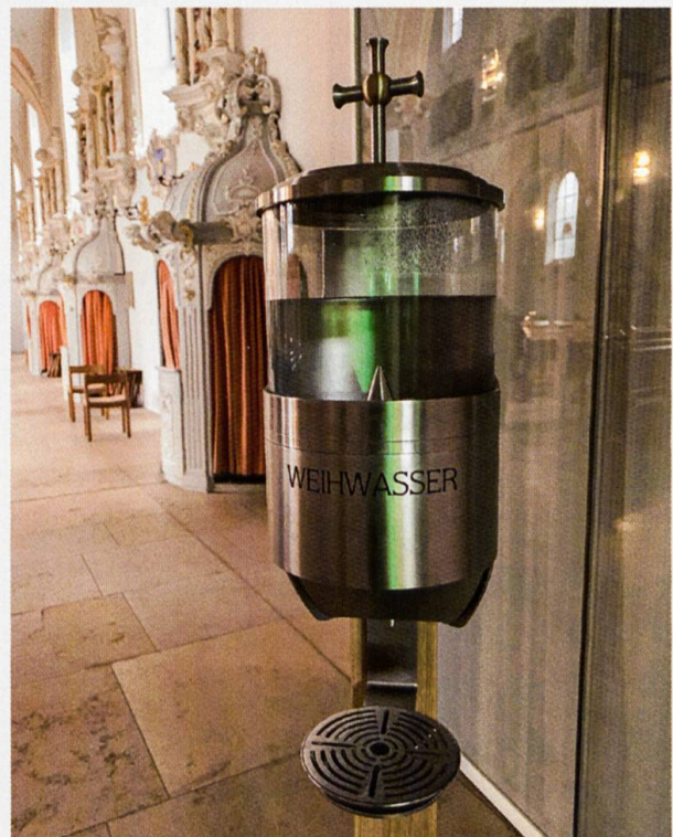
Weihwasser in Corona-Zeiten.

Das alles und vieles mehr, aber auch christliches Brauchtum, wird Ihnen in einer kleinen Broschüre erklärt, die Sie am Schriftenstand, an der Pforte oder im Klosterladen kaufen können (Fr. 2.-).