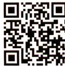
QR Code des Klosters Mariastein