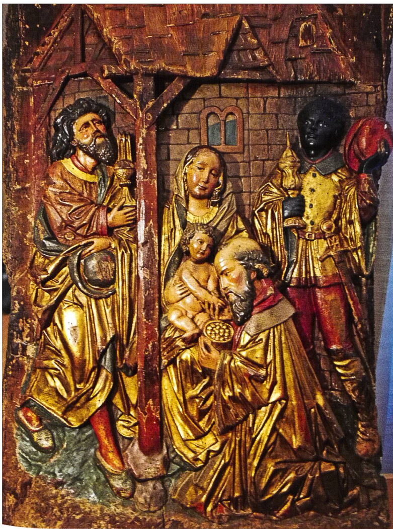
Aus einem Legat an das Kloster Mariastein: Maria mit Kind und die Heiligen Drei Könige (Relief, rheinländisch, um 1500).