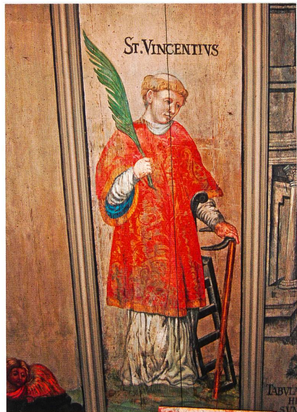
Hl. Vinzenz, Siebenschmerzen-Kapelle.