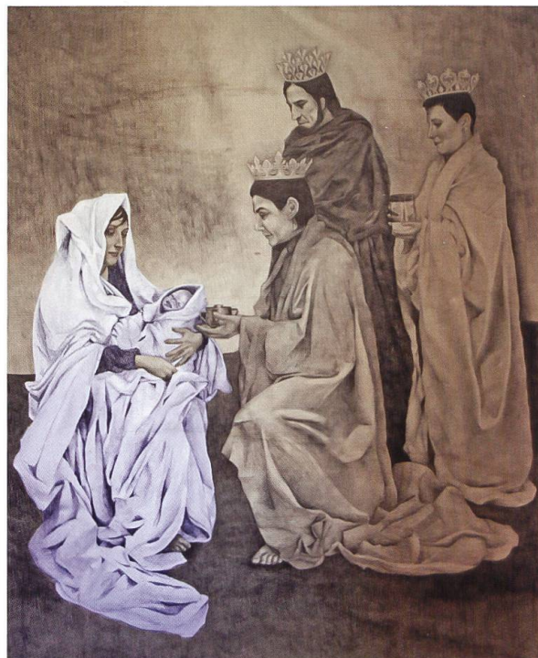
Anbetung der Könige (Vorhalle der Basilika). Die Ausstellung mit Bildern von Stella Radicati zum Leben der Gottesmutter Maria endet am 7. Januar 2020 nach einjähriger Ausstellungsdauer.