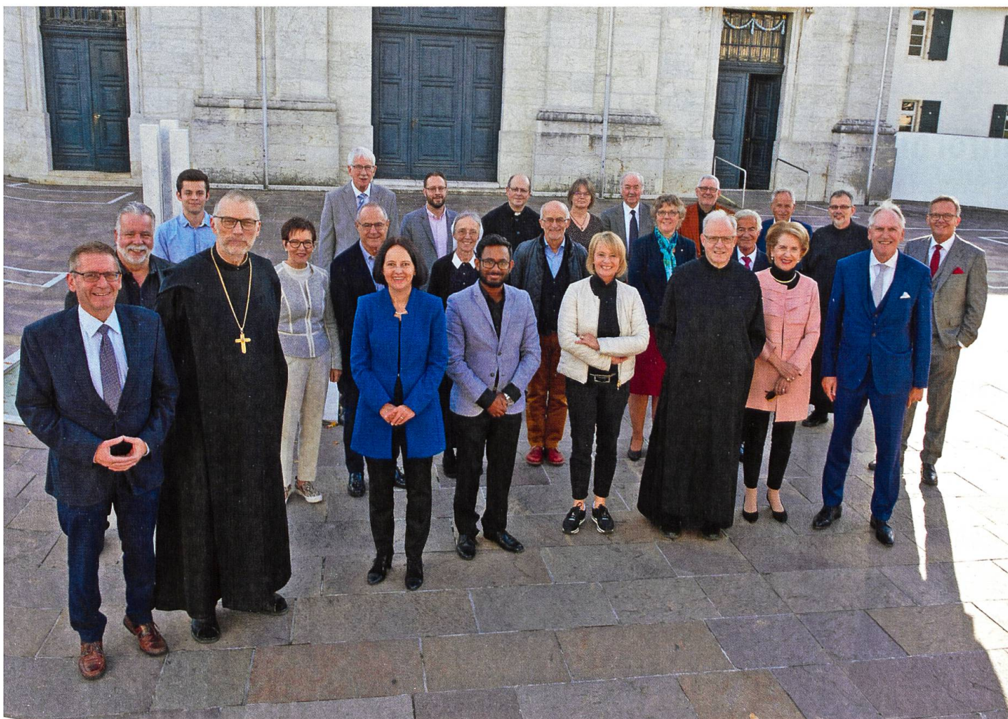
Das Patronatskomitee für das Projekt Mariastein 2025 versammelte sich am 12. Oktober 2019 in Mariastein.