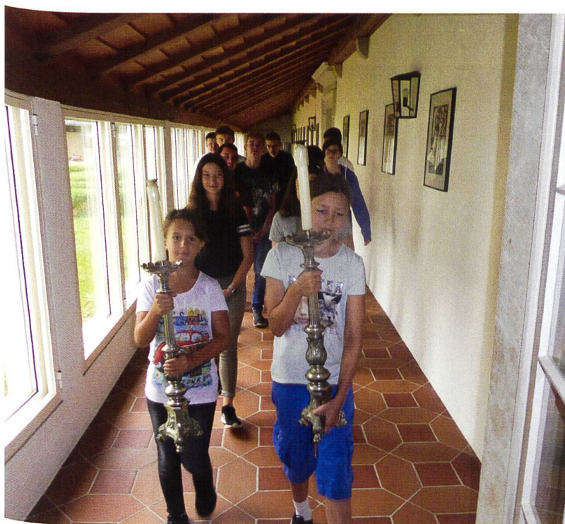
Bei der Monatswallfahrt im August 2019 waren Ministranten der Pfarreien Kappel-Boningen und Gunzgen im Einsatz.

vollendet hatte» (Genesis 2,3). Ich wünsche Ihnen, liebe Leserin, lieber Leser, den Segen Gottes alle Tage im kommenden Jahr 2020 und dass wir zwischendurch zur Ruhe kommen und Zeit zum Danken finden.