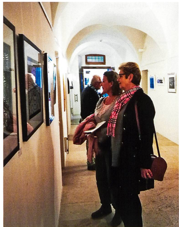
Gut besuchte Vernissage der Scherenschnitt-Ausstellung «Auf geht's!» im Klosterhotel Kreuz (noch bis 31. Januar 2020).

Am Freitag, 25. Oktober, trafen sich die Äbte der Schweizerischen Benediktinerkongregation und der Prior von Fischingen zu einem informellen Gedankenaustausch in St. Gallen. Besonders schätzten wir, dass Bischof Markus Büchel sich die Zeit nahm zum gemeinsamen Mittagessen und für eine Führung durch die Kathedrale. Eine Woche später, an Allerheiligen, waren zwei Vertreterinnen und vier Vertre-