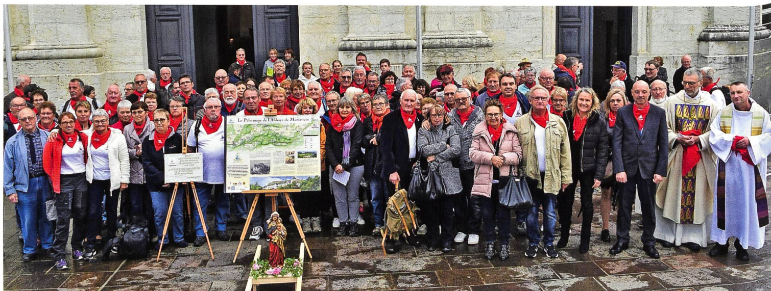
Liebevoll vorbereitete Jubiläumswallfahrt am 5. Oktober 2019: Zum 50. Mal pilgern die «Marcheurs de Levoncourt» im Herbst bei jedem Wetter die rund 40 km zu Fuss nach Mariastein.