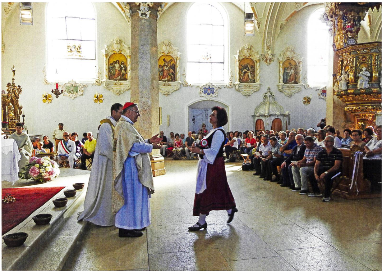
Seit 1919 pilgern die italienischsprachige Katholiken Basels jährlich zur Madonna im Stein, so auch am Eidgenössischen Betttag, am 15. September 2019. Nach wie vor ist das zahlenmässig einer der grössten Mariasteiner Wallfahrtsanlässe.