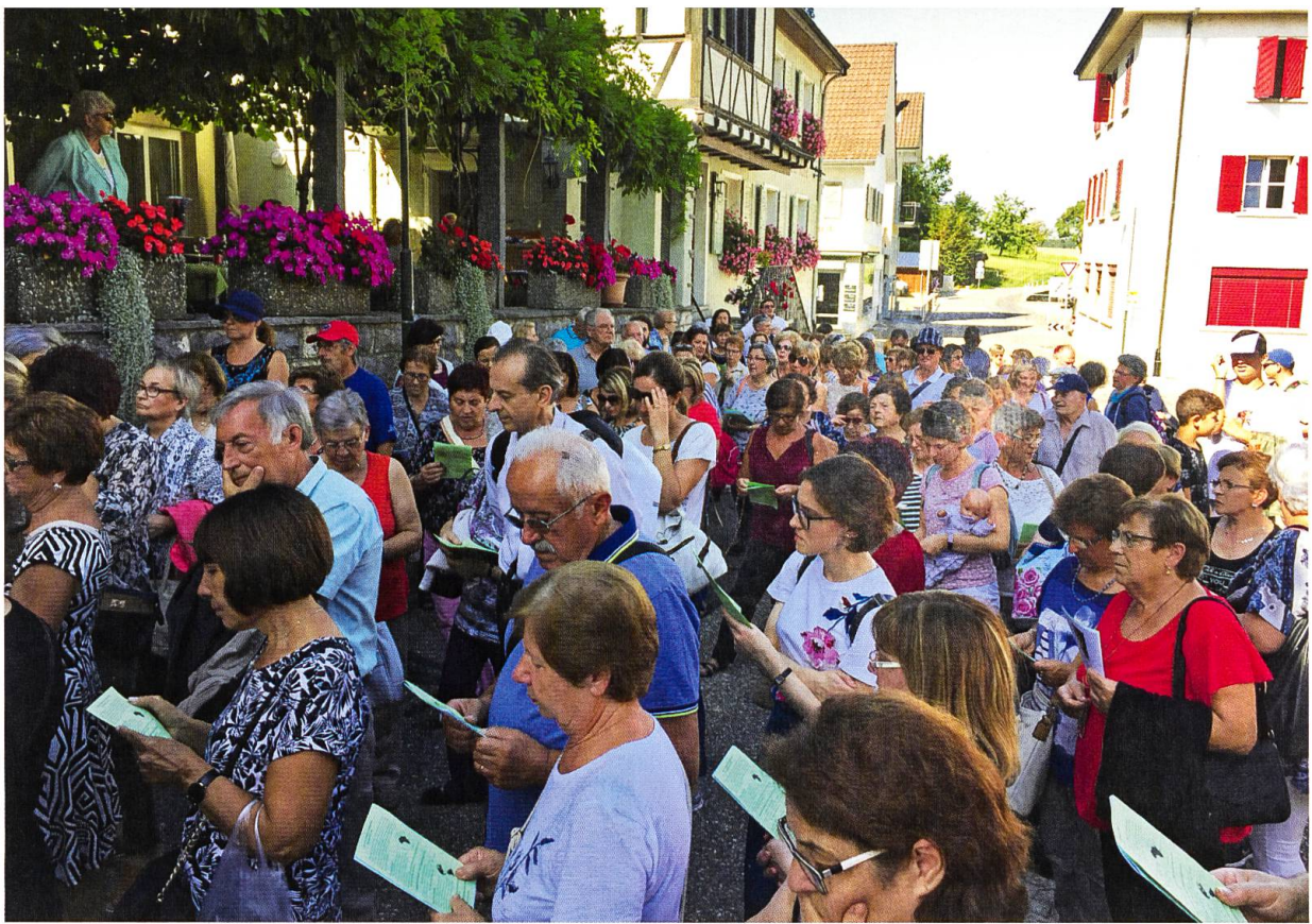
«Tutti a Mariastein!» war das Motto der Jubiläumswallfahrt der Missione Cattolica Italiana di Basilea, die 2019 ihr 100-jähriges Jubiläum feierte.