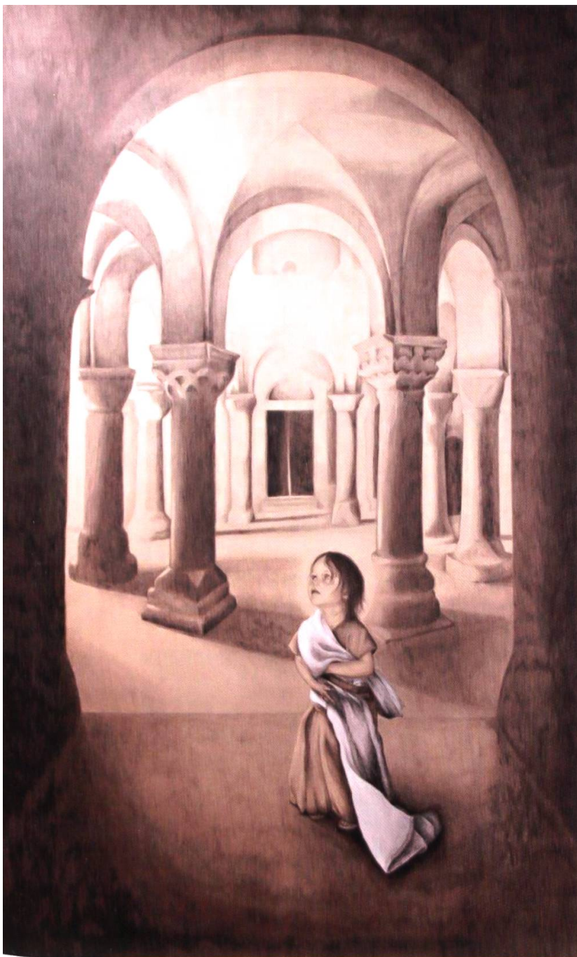
Mariä Tempelgang, von Stella Radicati (Teil der Ausstellung in die Josefskapelle). Die Begebenheit aus der Kindheit Mariens gehört nicht zur biblischen Überlieferung, wird aber im apokryphen Protoevangelium des Jakobus (2. Jh.) erzählt. Am 8. September feiert die Kirche den Geburtstag der Gottesmutter Maria, mit dem auch die verborgene Kindheit Mariens in Erinnerung gerufen wird. Gottesdienste in Mariastein siehe S. 33.