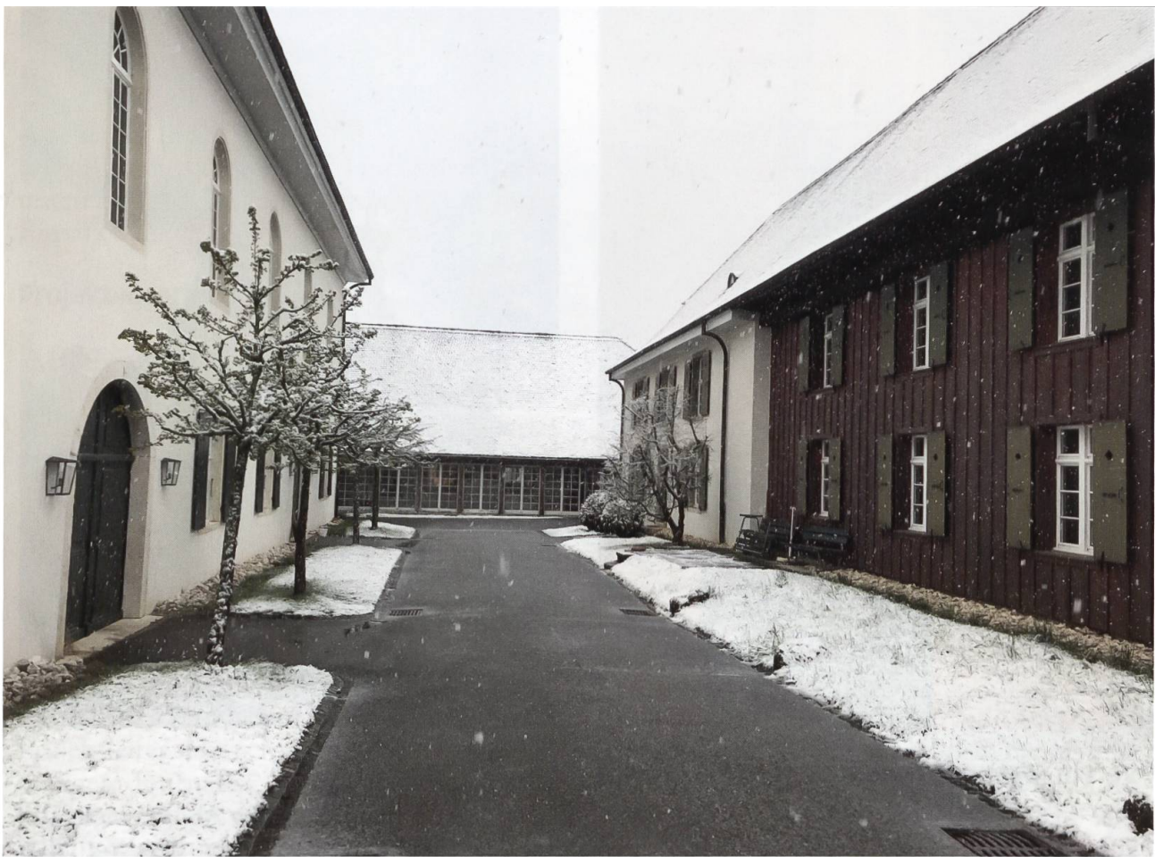
Wintereinbruch im April (4.4.2019, oben): links der Bibliotheksflügel, rechts das Gallus-Haus, dessen Mönchszellen die Hälfte unserer Gemeinschaft beherbergen.