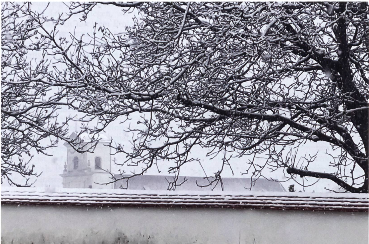
Wintereinbruch im Mai (4.5.2019, unten): Blick vom grossen Parkplatz über die Klostermauer zur Basilika.