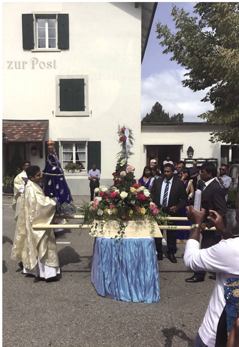
Grosse Wallfahrt der Tamilen am 18. August 2018: Tamilischer Priester mit der Madonna von Madu Matha (Sri Lanka).

Lourdespilgerverein linkes Zürichseeufer (7. Oktober) Groupe Notre-Dame de la Lumière (Blindenseelsorge Romandie) (18. Oktober) Pilgergruppe aus Sementina TI (6. Dezember)