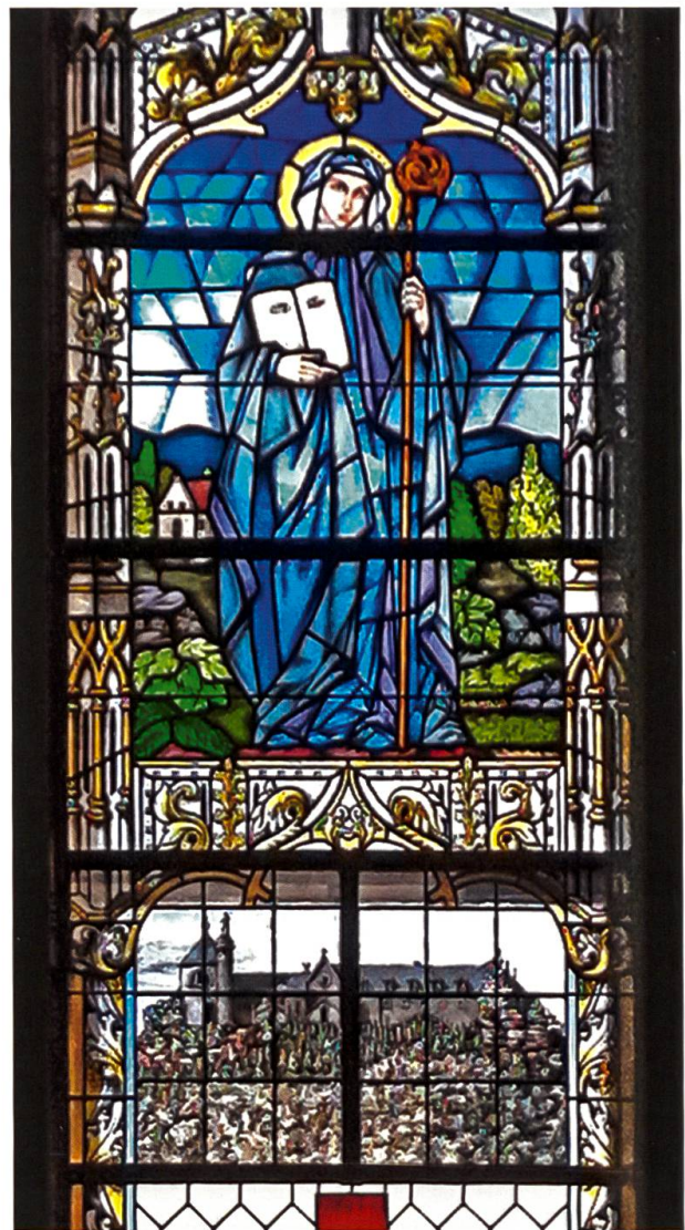
Die heilige Odilia, Patronin des Elsass, hier in einem Kirchenfenster in Michelbach-le-Haut (F, 2003). Die Augen auf dem Buch deuten darauf hin, dass die Äbtissin, die selbst von Blindheit geheilt wurde, Patronin gegen Augenleiden ist. Auf dem unteren Segment des Kirchenfensters ist das Heiligtum des Odilienberges (Mont Sainte-Odile) erkennbar.