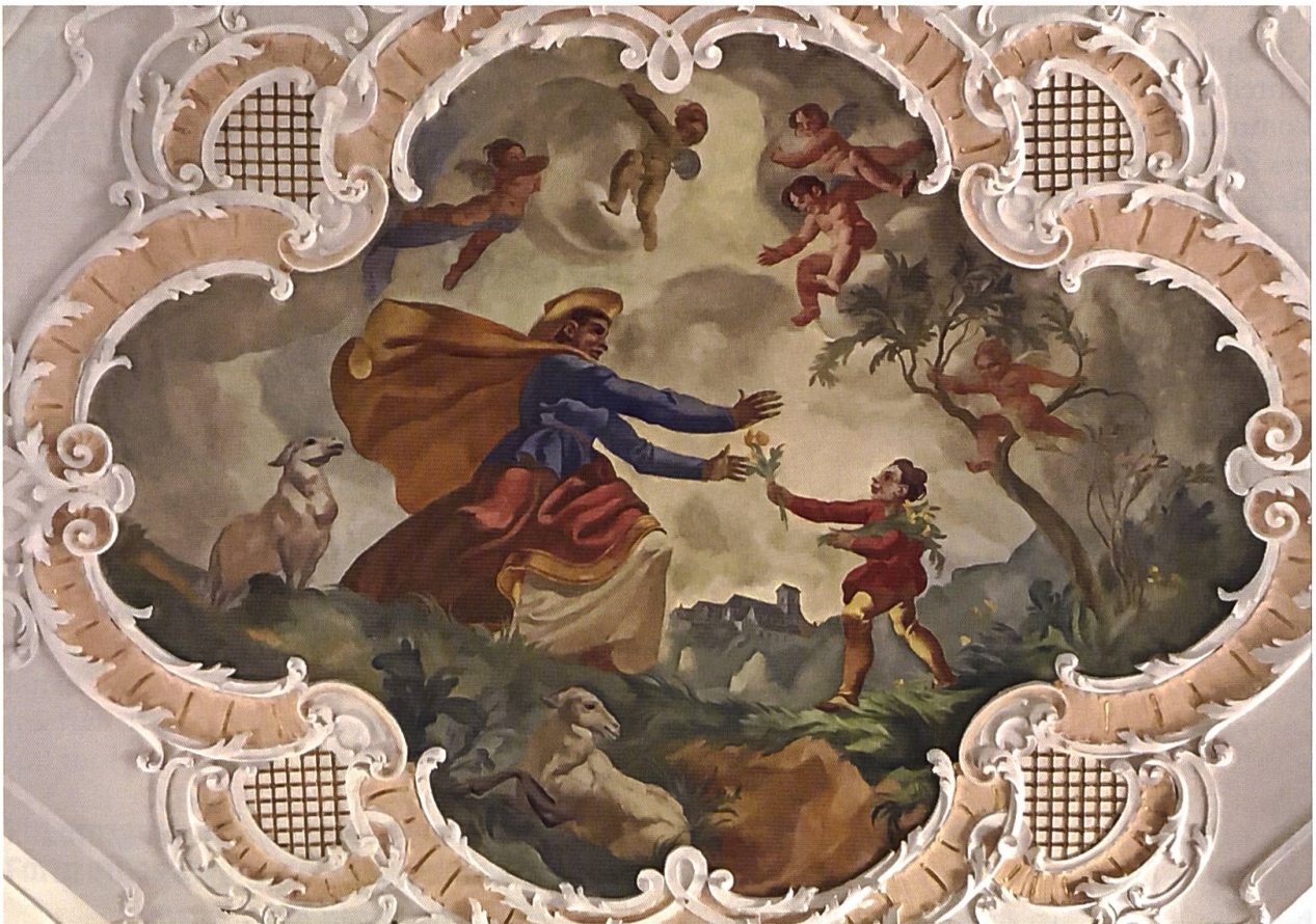
Deckengemälde in der Basilika: Die Mutter findet das Kind, das die Felswand von Mariastein hinabgestürzt ist, wohlbehalten am Fuss des Felsens wieder.

Die Verserzählung fährt dann fort mit der Erwähnung von Dorneck und der Schlacht bei Dornach im Jahre 1499, kommt dann auf den oberen Hauenstein, auf Schöntal, Liestal und Augst zu sprechen und geht dann über zur Stadt Basel.