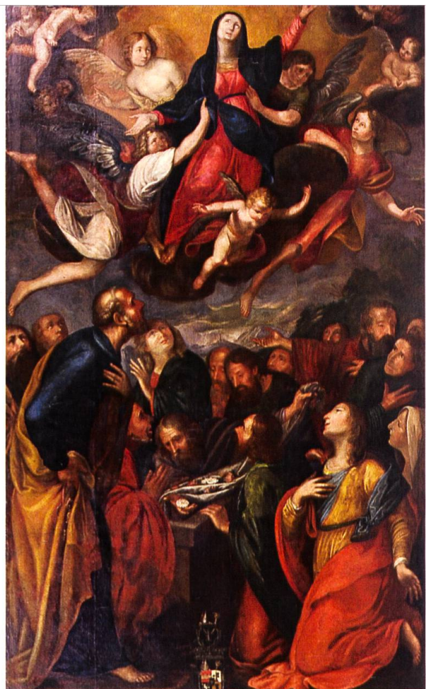
Hochaltarbild für Mariä Himmelfahrt (15. August) in der Klosterkirche Mariastein.

Weitere Informationen und Anmeldeunterlagen sind an der Klosterpforte erhältlich (Tel. 061 735 11 11).