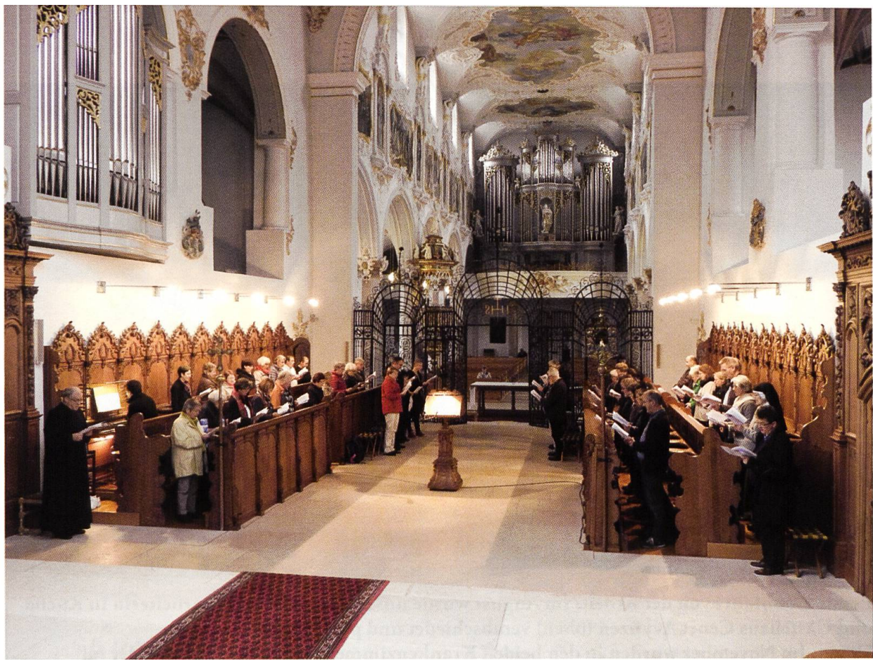
Oktober 2016: Schon zum zweiten Mal fand die Solothurner Kirchenmusikwoche nicht in Solothurn, sondern in den Räumlichkeiten des Klosters Mariastein statt. Oben: Morgenlob der Teilnehmerinnen und Teilnehmer im Chorgestühl der Mönche. Unten: Abschlussgottesdienst in der Basilika am 15. Oktober 2016.