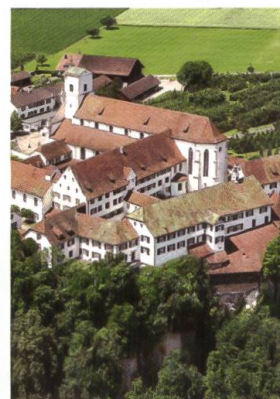
Bild- und Textband über das Kloster Mariastein