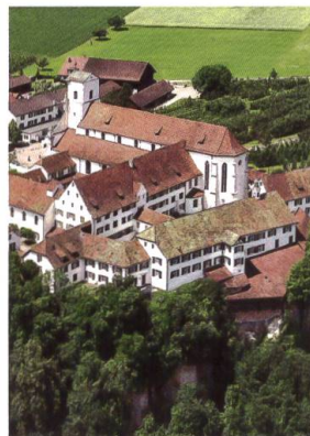
Bild- und Textband über das Kloster Mariastein