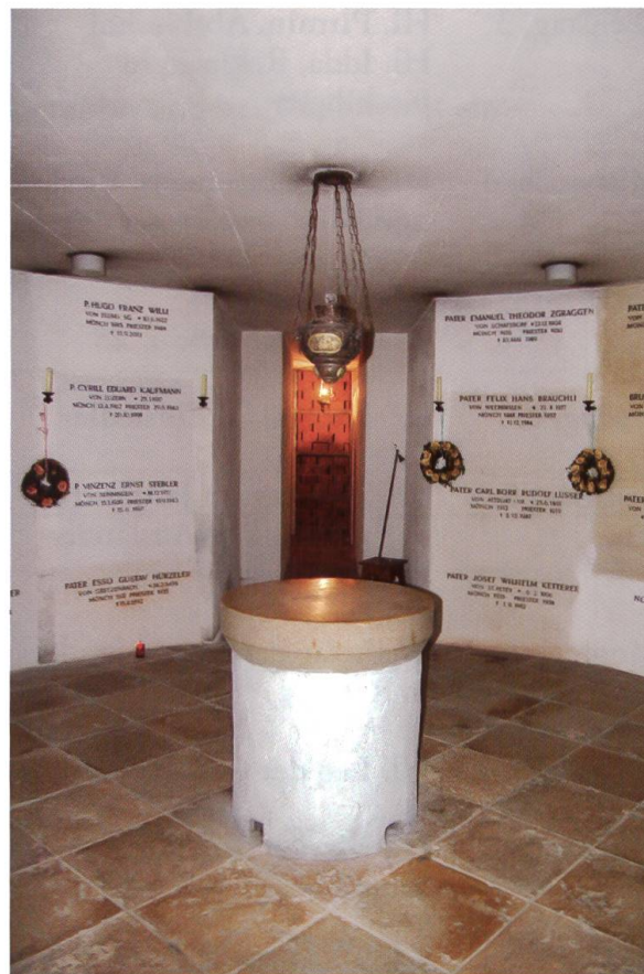
Totengruft der Mönche unter der Basilika in Mariastein.