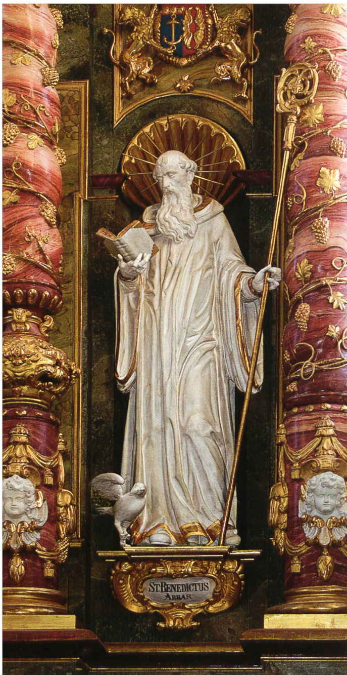
Der heilige Benedikt. Rechte Statue des Mariasteiner Hochaltars (1680).

haben sie missioniert, sondern durch eine sanfte Präsenz: «Mit Kreuz, Buch und Pflug», diesen Topos greift Papst Paul VI. in seinem Motu Proprio vom 24. Oktober 1964 auf (siehe Seite 15), um die Art zu charakterisieren, wie das Mönchtum seit Beginn des Mittelalters auf die europäische Kultur eingewirkt hat: Christlicher Glaube (Kreuz), Bildung (Buch) und praktisches Know-how (Pflug) sind die Elemente, mit denen Mönche des heiligen Benedikt Europa befruchtet haben.