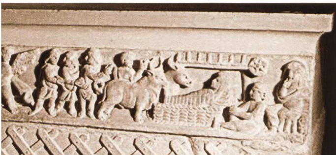
Paläochristlicher Sarkophag (4. Jh.) in Boville Ernica (Italien): Die Geburt Jesu mit Ochs und Esel, aber noch ohne Maria und Josef.

In unserem Beispiel macht sich dieser Zugang am Stichwort «Krippe» im Lukas-Evangelium fest. Welche Querverbindungen und Assoziationen weckt die Erwähnung dieses Details in der Geburtsgeschichte Jesu bei jenen, die vertraut sind mit der ganzen Heiligen Schrift, also auch mit dem Alten Testament? Es ist vor allem ein Wort vom Anfang des Jesaja-Buches, das sich da unweigerlich ins Bewusstsein drängt: