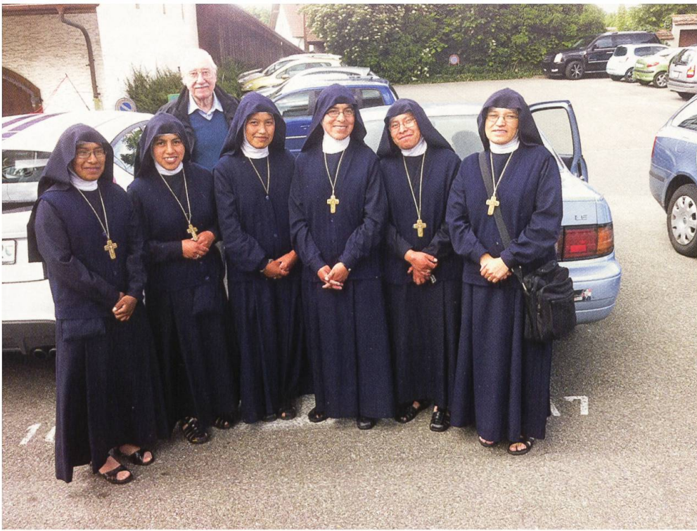
Ende Mai weilten einige Schwestern aus Cuzco in Peru bei uns. Sie gehören zu den «Dienern der Armen der Dritten Welt», die von P. Hugo sel. eifrig unterstützt wurden.

und der Frauenklöster gemeinsam abgehalten. Es war eine gute Gelegenheit, die betriebliche Zusammenarbeit zwischen Kloster und Hotel Kurhaus Kreuz umzusetzen. Das zeigt sich auch daran, dass während der Betriebsferien im Hotel Kurhaus Kreuz die Klosterküche die Mahlzeiten für die Schwestern zubereitet. Wir hingegen beziehen unser Essen Ende Juli, Anfang August vom «Kreuz». In diesen zwei Wochen bleibt unser Gästebetrieb geschlossen, weil der Fussboden im Gästerefektorium erneuert wird.