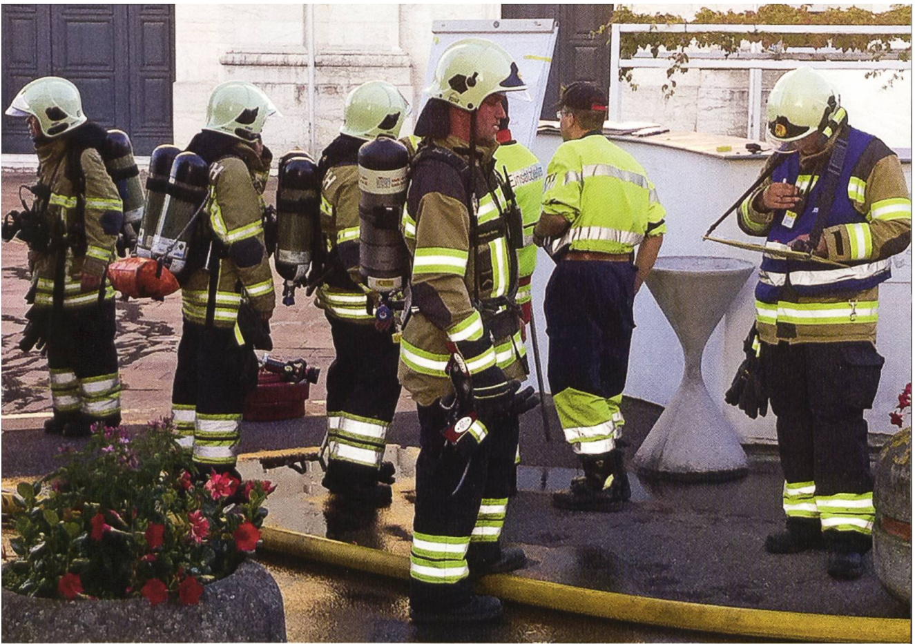
Zu unserer Sicherheit (rechte Seite und oben): Am Abend des 6. Juni führten die Feuerwe- ren von Metzleren, Rodersdorf und Reinach mit 60 Mann auf dem Klostersgelände eine Übung durch.