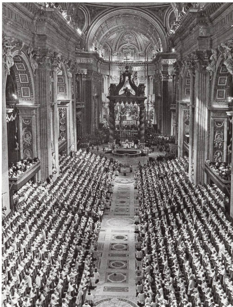
50 Jahre Zweites Vatikanisches Konzil: Aus diesem Anlass werden unsere diesjährigen Fastenpredigten (siehe rechts) gewichtige Worte der Konzilstexte in Erinnerung rufen.