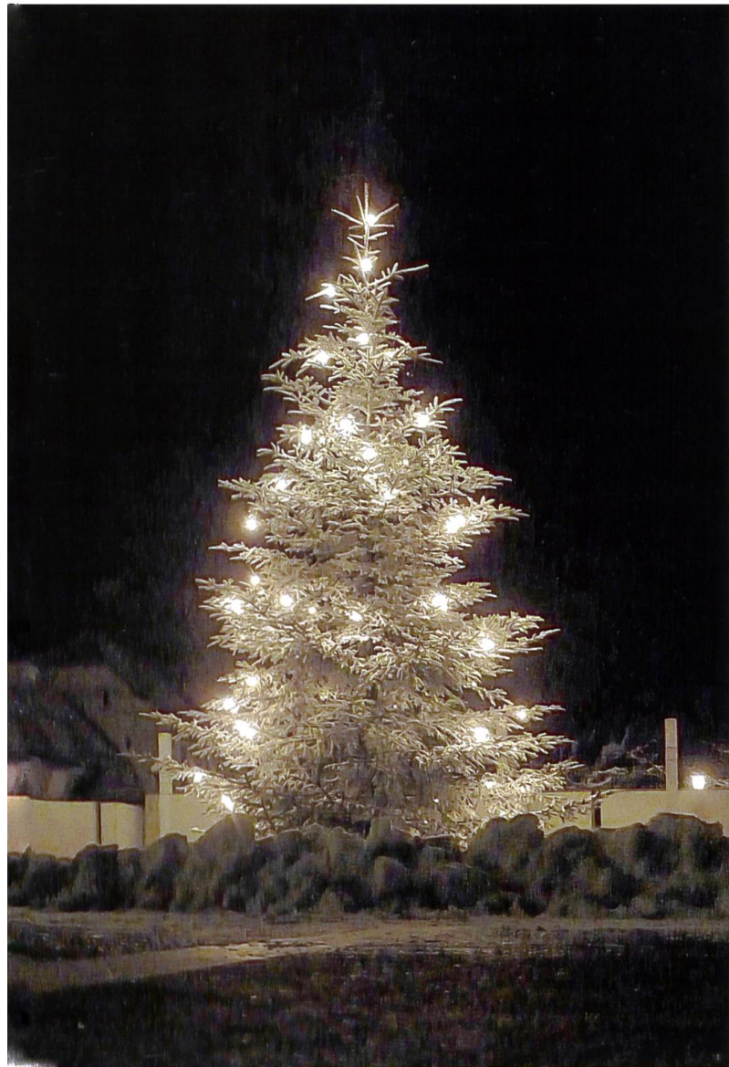
Weihnachtsstimmung auf dem Klosterplatz.