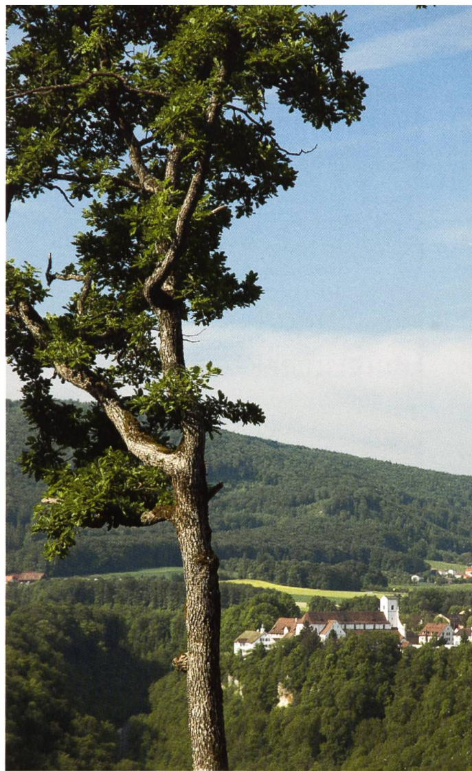
Blick vom Hofstetter Chöpfli auf Mariastein und Metzerlen (hinten). Links: Eine der 56 neuen Infotafeln des Waldwanderwegs (Burg Landskron)

Zur besseren Orientierung können sich Waldwanderfreudige bei den Gemeindeverwaltungen oder den Tourismusbüros der Region einen Faltprospekt beschaffen – mit Kartenausschnitt, eingezeichneter Route, empfohlenen Teilabschnitten, genauer Wegbeschreibung und vielen nützlichen Tipps. Die Faltprospekte aller Solothurner Waldwanderungen sind zudem zu finden unter: www.waldwanderungen.so.ch .