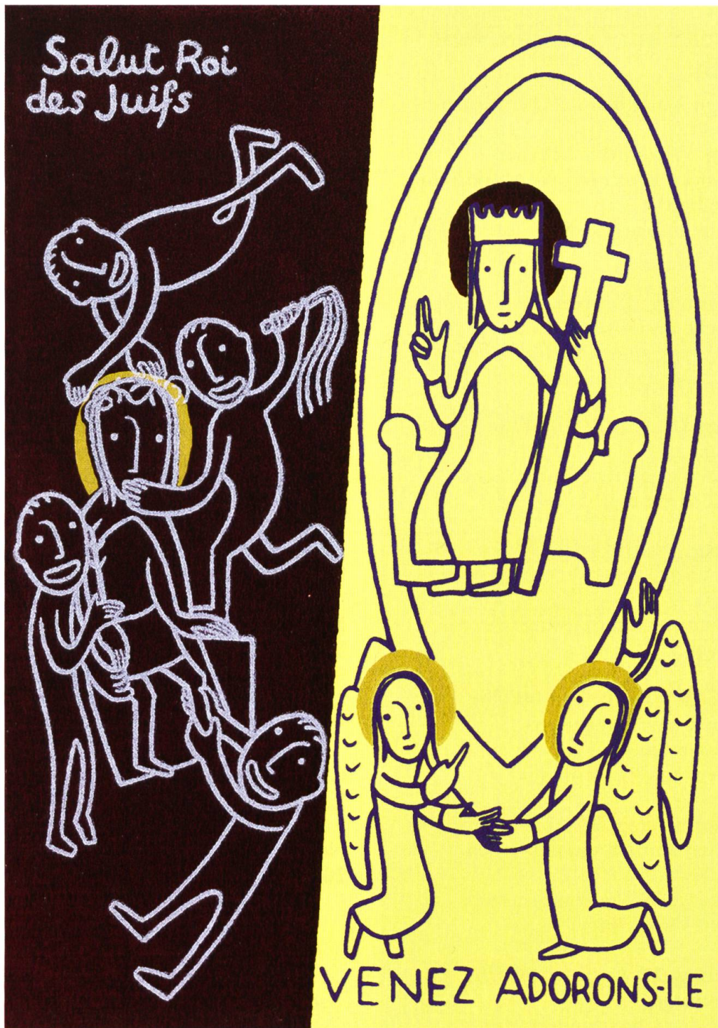
Passion und Herrlichkeit der Auferstehung. «Heil dir, König der Juden» und «Kommt, beten wir ihn an», von Frère Yves Vitry OSB, La Pierre-Qui-Vire. Die Motive von S. 5 und S. 35 sind als Postkarten-Set zusammen mit anderen Motiven des Kirchenjahres (vgl. Mariastein 6/2010) im Benediktinerkloster Abbaye de la Pierre-Qui-Vire (F-89630 Saint-Leger-Vauban) erhältlich.