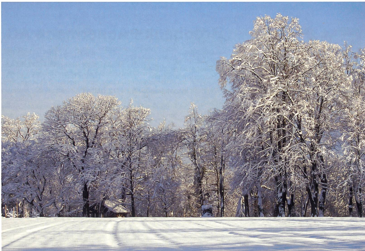
Winterliches Mariastein: Die Klosterallee (oben) und (S. 104) das Kloster von Süden (Dezember 2008).