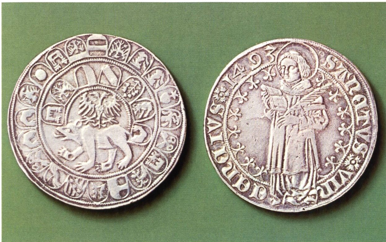
Bild unten: Taler der Stadt Bern von 1493. Auf der einen Seite Darstellung des Schutzpatrons Vinzenz (rechts, mit der Märtyrerpalme); auf der Rückseite der Berner Bär mit dem Reichsadler und den Wappen der Vogteien (Historisches Museum Bern).

Die wechselvolle Geschichte des Berner Münsters, der grössten und wichtigsten spätmittelalterlichen Kirche der Schweiz, erinnert bis heute auch an die bewegte Geschichte der Verehrung des heiligen Vinzenz in Bern.