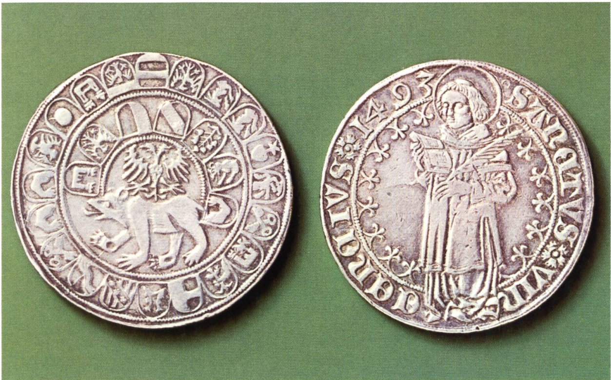
Bild unten: Taler der Stadt Bern von 1493. Auf der einen Seite Darstellung des Schutzpatrons Vinzenz (rechts, mit der Märtyrerpalme); auf der Rückseite der Berner Bär mit dem Reichsadler und den Wappen der Vogteien (Historisches Museum Bern).

Die wechselvolle Geschichte des Berner Münsters, der grössten und wichtigsten spätmittelalterlichen Kirche der Schweiz, erinnert bis heute auch an die bewegte Geschichte der Verehrung des heiligen Vinzenz in Bern.