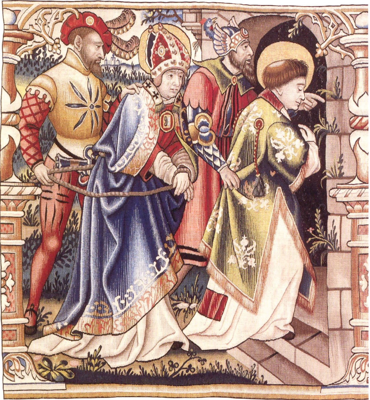
In fünf Szenen schildert der zweite Chorbehang die Einkerkering, die Verurteilung und das Martyrium des heiligen Vinzenz. Die erste Darstellung hält fest, wie Bischof Valerius (Mitte) und sein Diakon Vinzenz (rechts) ins Gefängnis von Valencia abgeführt werden. Ein Scherge ist dargestellt als römischer Soldat, der andere als zeitgenössischer Reisläufer (aus: Anna Rapp Buri, Monica Stucky-Schürer und Stefan Rebsamen: Leben und Tod des heiligen Vinzenz. Vier Chorbehänge von 1515 aus dem Berner Münster. Glanzlichter aus dem Bernischen Historischen Museum 4, 2000).