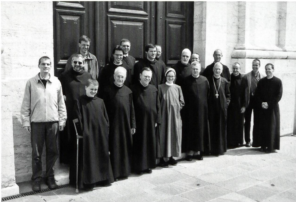
Am 12. Mai war die Theologische Schule des Klosters Einsiedeln zu Besuch in Mariastein. Die Studierenden, Benediktiner aus verschiedenen Schweizer und ausländischen Klöstern, darunter auch eine Benediktinerin, und freie Studenten, sowie einige Dozenten waren Gäste unserer Klostergemeinschaft beim Mittagessen. Vor ihrer Weiterfahrt liessen sie sich durch Kirche und Kapellen führen und interessierten sich für die Schicksale unseres Klosters.