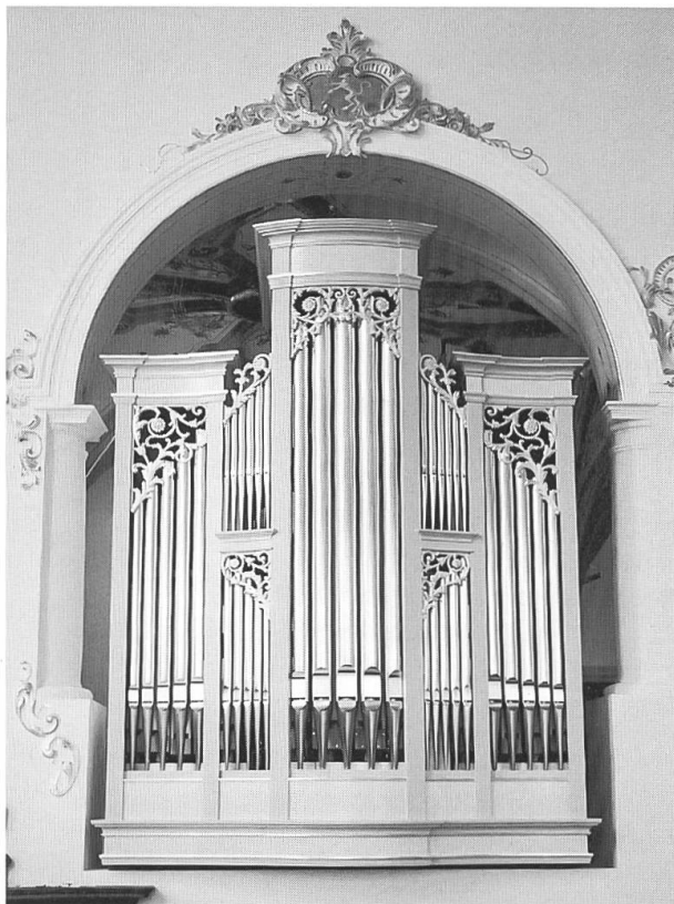
Am 22. November gedenkt die Kirche der hl. Cäcilia, der Patronin der «Musica Sacra». – Das Bild zeigt den Prospekt der neuen Chororgel.

dass Menschen, die in der Fremde alt und krank geworden sind, Gottes Nähe erfahren und Mitmenschen finden, die sie begleiten.