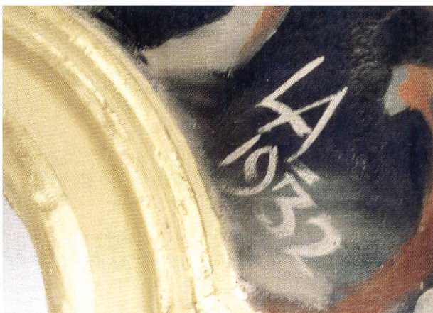
Einzelne Bilder signierte der Künstler mit Namen oder mit den Initialen. Die Zahl erinnert an das Jahr, in dem das Werk geschaffen wurde.

unter anderem Folgendes: Er kam 1902 in Sachsen zur Welt und liess sich 1922/23 in Leipzig zum Maler und Grafiker ausbilden. Bis 1928 hielt er sich in Paris auf, dann liess er sich in Basel nieder, wo er später auch das Bürgerrecht erwarb. Hauptsächlich führte er religiöse Darstellungen in Wand- und Glasbildern aus. Als erstes grösseres Werk wird das Altarbild in der Kirche von Schönbrunn ZG aufgeführt, dann werden die Wandmalereien in der Basilika Mariastein erwähnt (1931/1933), ein Jahr später malte der Künstler die Taufkapelle von Kappel SO aus. In den Dreissiger- und Vierzigerjahren folgten Werke in den Kirchen von Münchenstein, Triengen, Kleinhüningen (St. Christophorus), Dietwil, Rotkreuz Ibach und Waldkirch. Für verschiedene Gotteshäuser entwarf Albert Glasbilder. Der Künstler starb im Jahr 1972.