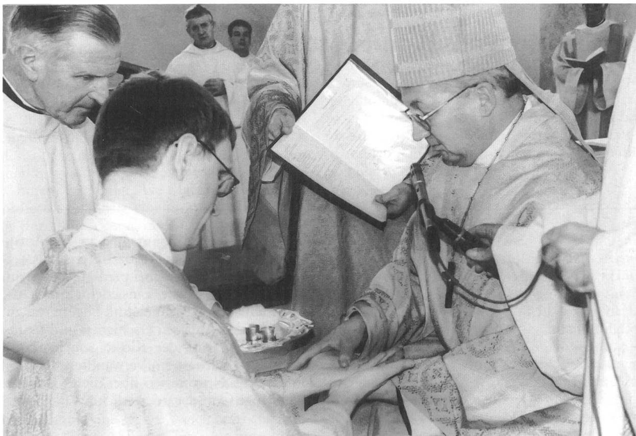
Der Bischof salbt dem Neupriester die Hände mit Chrisam.