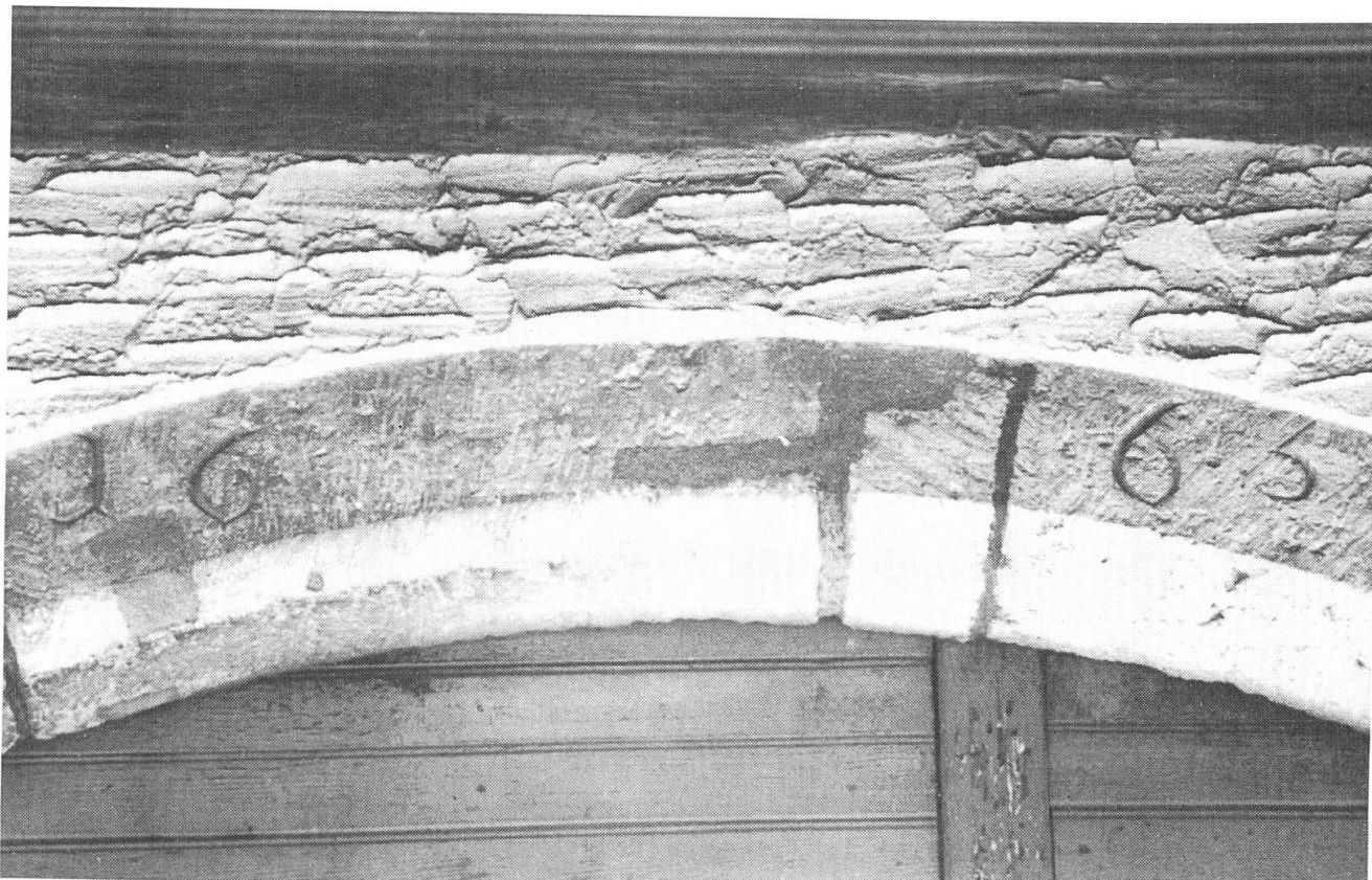
Torbogen mit der Jahreszahl 1663 aus der älteren Bauphase des Hofes.