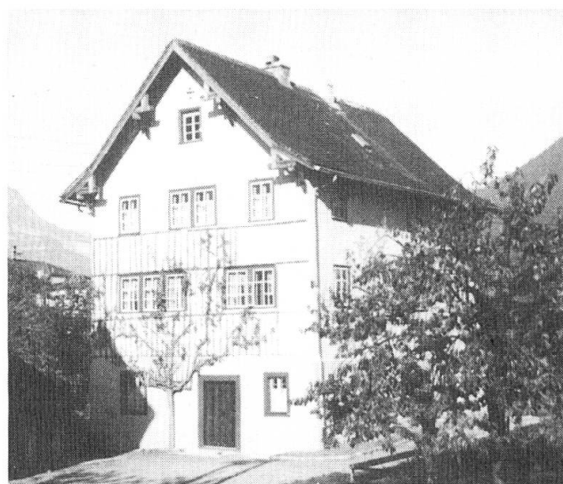
Das sog. Brickerhaus.

den (Abt an den Erziehungsrat, 13. September). Somit war die Weiterführung der land- und alpwirtschaftlichen Winterschule gesichert. Die Planung einer selbständigen Landwirtschaftsschule wurde getreu weiterverfolgt. Nach dem Studium verschiedener Projekte entschied sich der Landrat für einen Neubau (Schule und Internat) in Seedorf. Am 26. Mai 1957 gab das Volk mit knappem Mehr (2920 Ja gegen 2349 Nein) dazu seine Zustimmung. Der Neubau konnte im November 1958 bezogen werden, und die neue Schule nennt sich fortan Kantonale Bauernschule Uri in Seedorf. So endete die Landwirtschaftsschule am Kollegium, wozu das Kloster Mariastein neben den Lehrkräften das Brickerhaus als Internatsgebäude zur Verfügung gestellt hatte, nach genau zwanzig Jahren. Dazwischen lagen einige Spannungen und Querelen, aber für die meisten Landwirtschaftsschüler, die in diesen zwanzig Jahren die Schule und das Internat besucht hatten, waren es fruchtbare Jahre, für die sie sich dankbar zeigten.