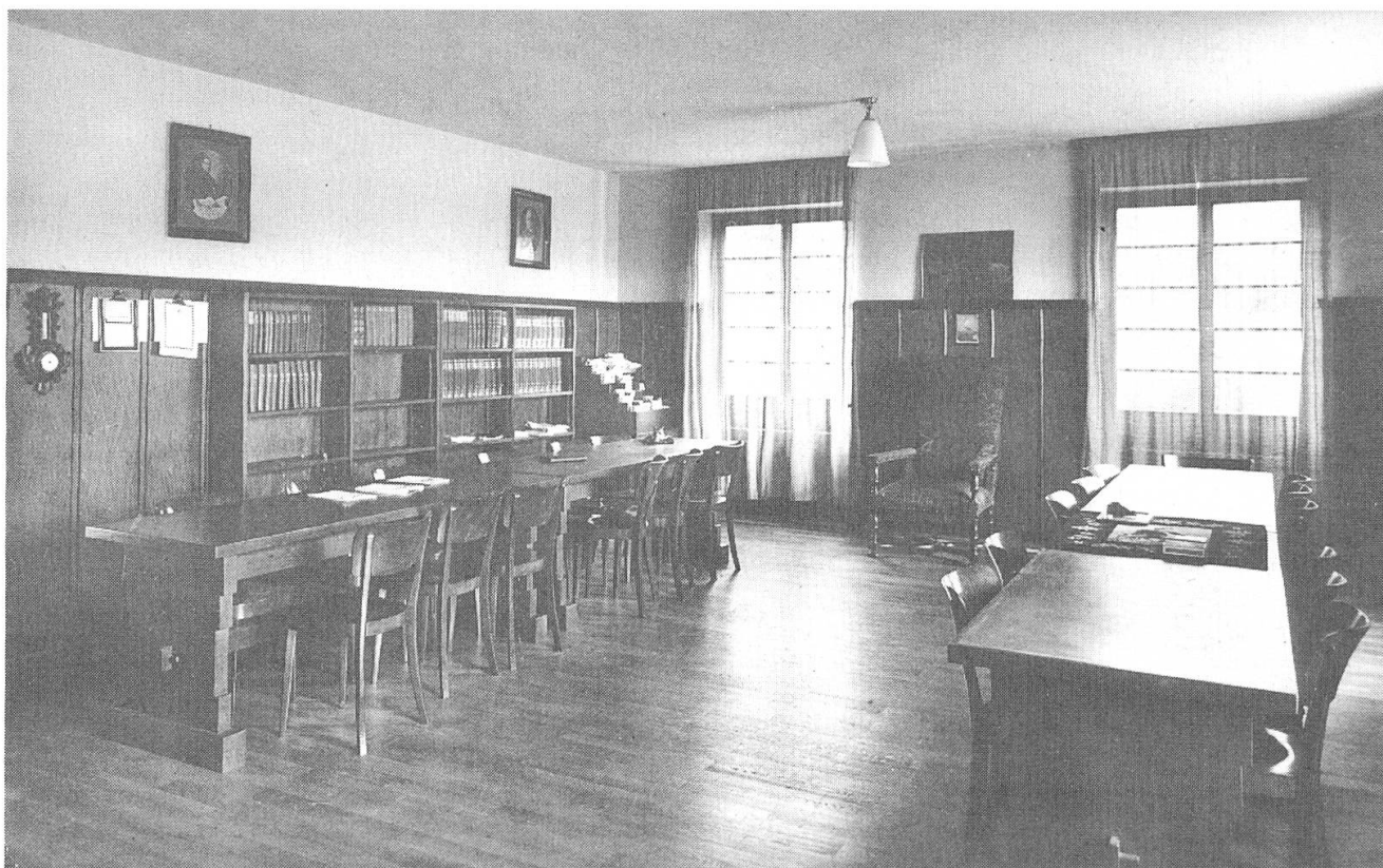
Blick in das Lesezimmer des Professorenheimes.

diktusverein) wieder einen eigenen Wohnsitz in der Schweiz. Platz war nun auch da, um mehr Patres (und Brüder) aufzunehmen. Das Haus hatte im ersten und zweiten Obergeschoss zusammen 17 Wohnzimmer für Patres, und im ausgebauten Dachstock waren 7 Zimmer für die Brüder vorgesehen, dazu kam ein Pförtnerzimmer neben der Pforte. Einige Zimmer für Gäste mussten freigehalten werden. Der Ausbau der Schule verlangte auch wieder mehr Lehrer. Abt Augustin schickte darum Patres für eine Fachausbildung an Universitäten, teils sogar ins Ausland, was dann sein Nachfolger, Abt Basil, weiterführte. Bereits im Schuljahr 1937/38 waren 16 Patres am Kollegium tätig, im Schuljahr 1939/40 waren es 18 Patres. Dazu kamen 8 Laienbrüder. Vier Patres (Rektor und drei Präfekten) wohnten weiterhin im Internatsgebäude, ebenso ein Bruder, der dort seine Arbeit verrichtete.