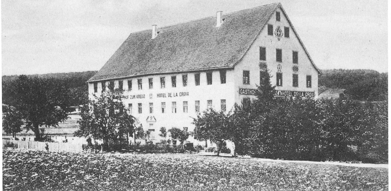
Mariastein. Hotel zum Kreuz.

unserem Jahrhundert wurden Eingriffe in das Äussere vorgenommen, um den damaligen Erfordernissen zu genügen.