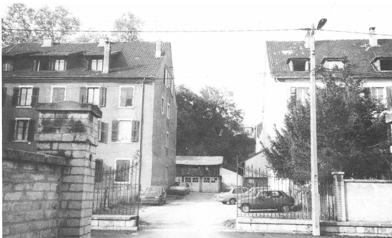
Delle heute: Zwischen diesen Häusern stand einst die Kirche.

der Dominikanerinnen in Delle, die 1876 hierher gekommen waren und ebenfalls 1901 wegziehen mussten, nach dem Verkauf profaniert wurde, d. h. als Cinéma und Tanzsaal benutzt wurde. Zudem war nach dem Urteil des Architekten Jauch die Kirche der Benediktiner offenbar in schlechtem baulichen Zustand.