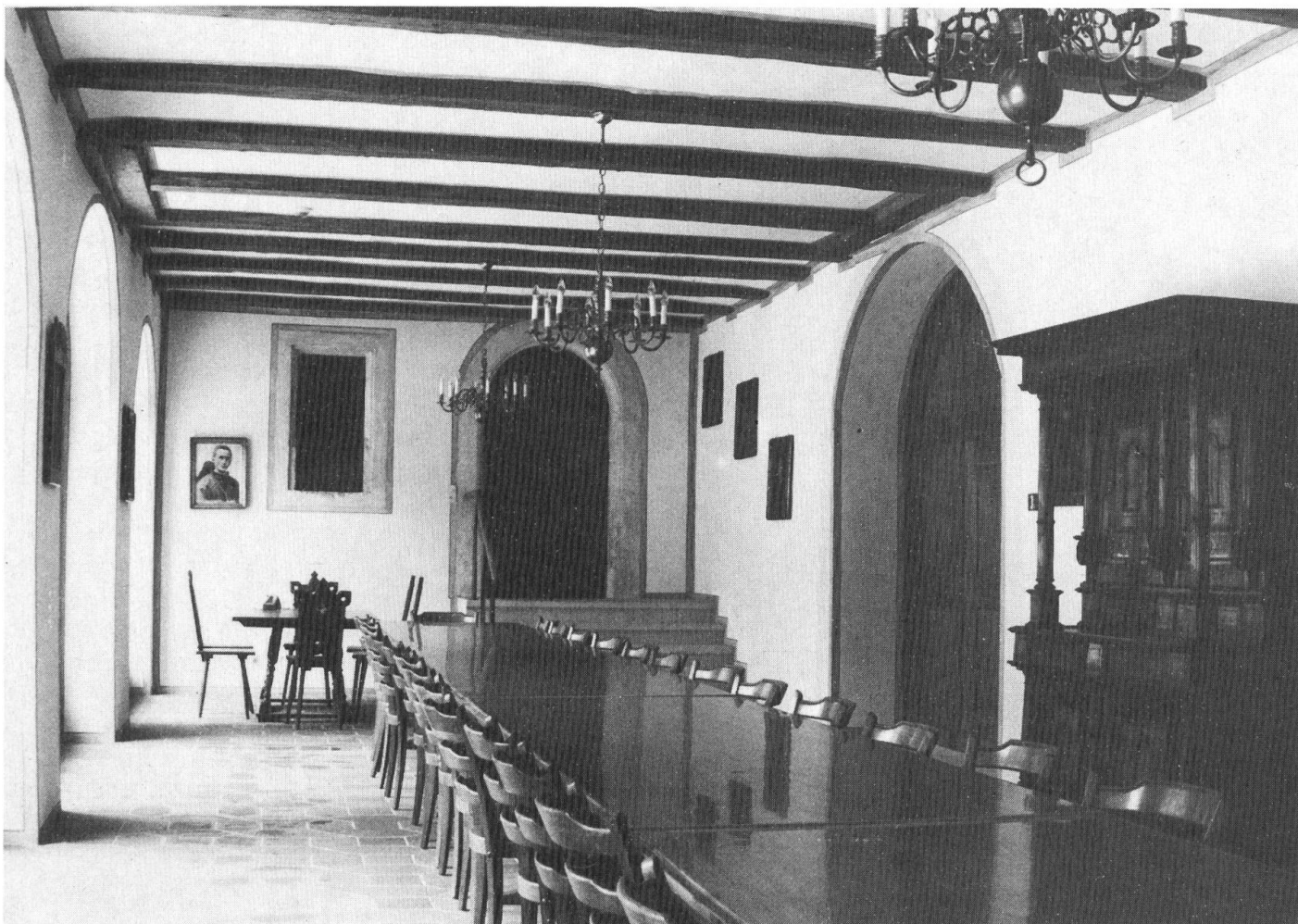
Der neu gestaltete Gemeinschaftsraum im Erdgeschoss des «Brüggli» (vergleiche folgenden Artikel Seite 150).