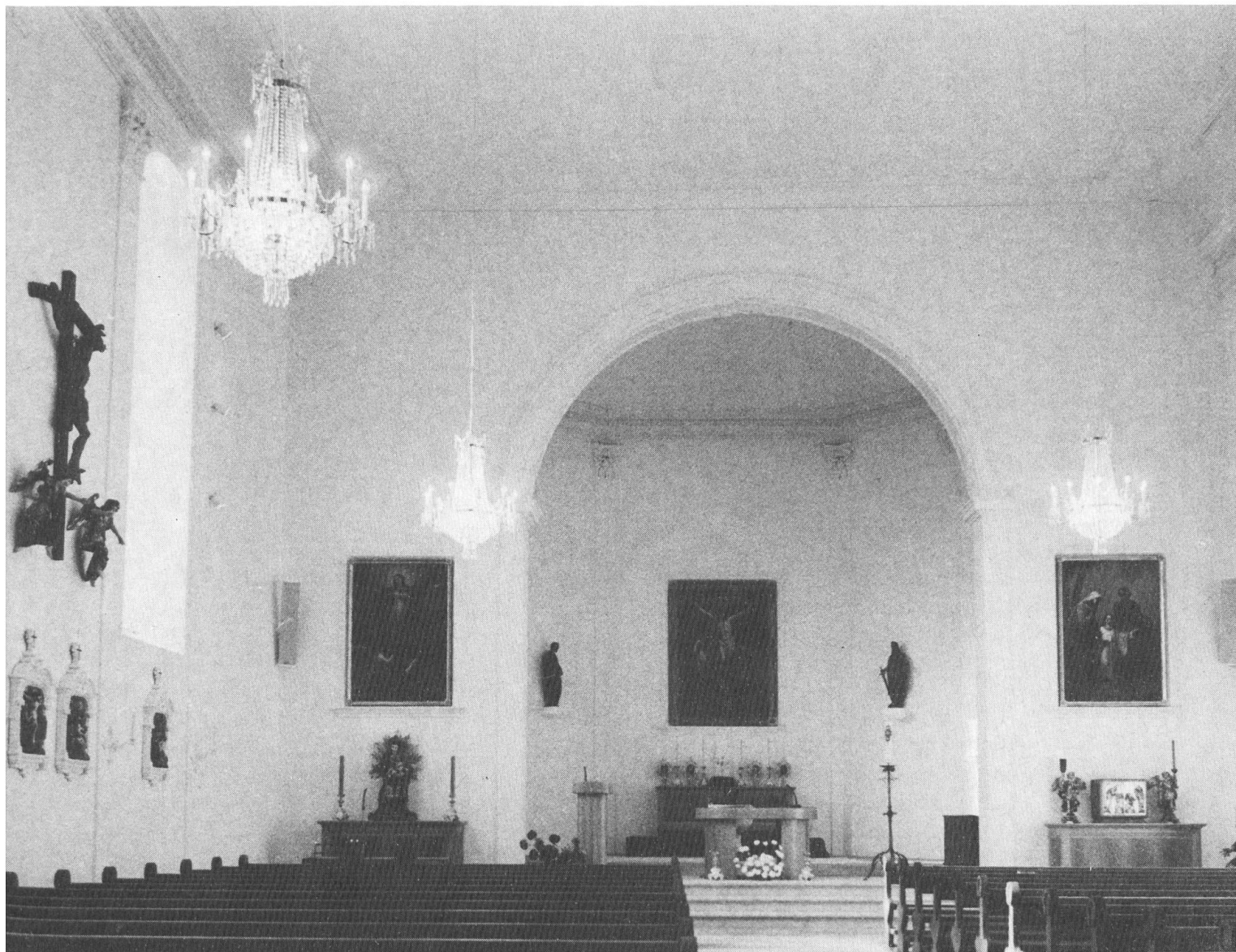
Das Gotteshaus Erschwil im neuen Glanz