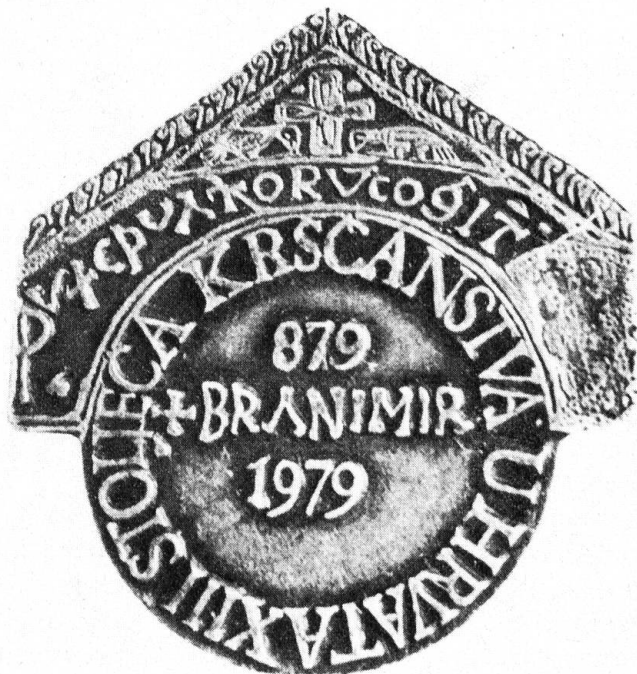
Jubiläumsplakette: 11 Jahrhunderte seit der offiziellen und definitiven Bindung Kroatiens an den Päpstlichen Stuhl, genannt «Das Jahr des Königs Branimir», und 13 Jahrhunderte seit der Christianisierung durch die Benediktiner.

Die Christianisierung, die anfangs 7. Jh. begann, endete um das Jahr 800. Das erste Benediktinerkloster ist sehr wahrscheinlich um das Jahr 800 in Nin, während der Regierungszeit von Fürst Vis-