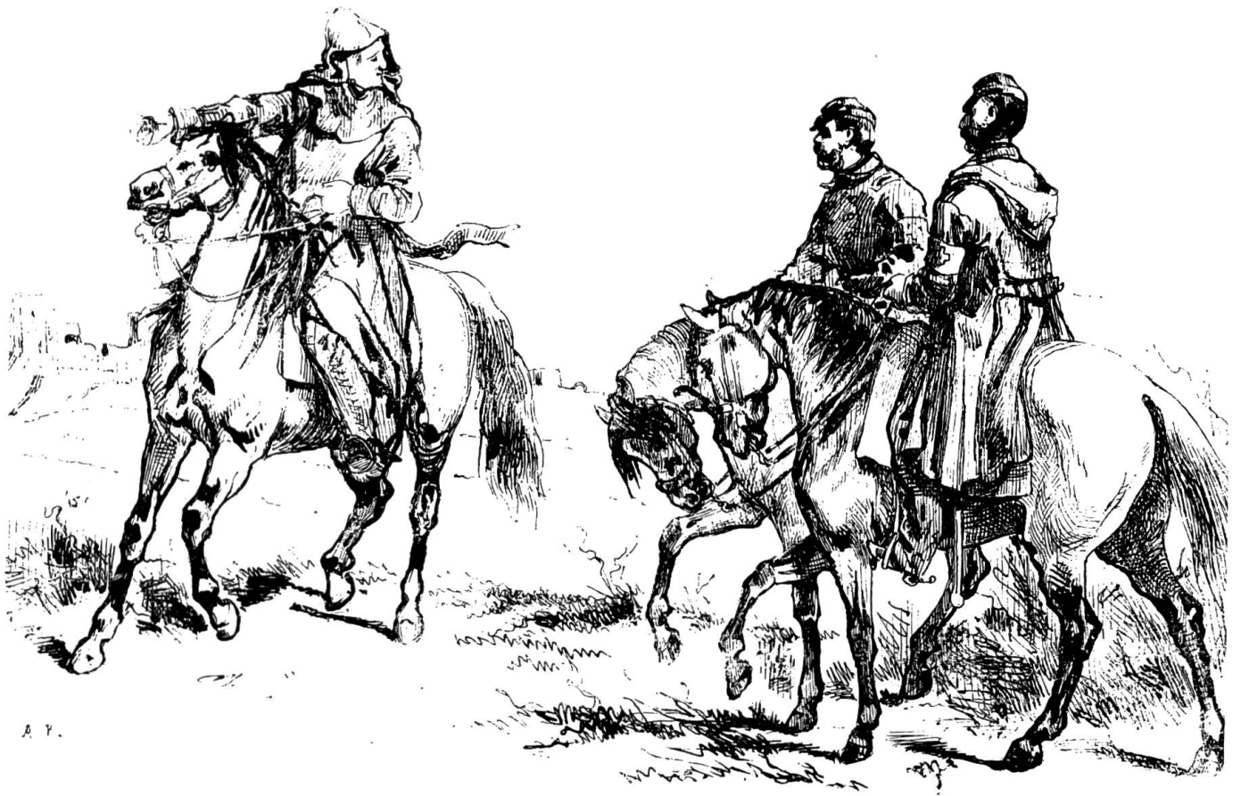
Une reconnaissance à Mariastein