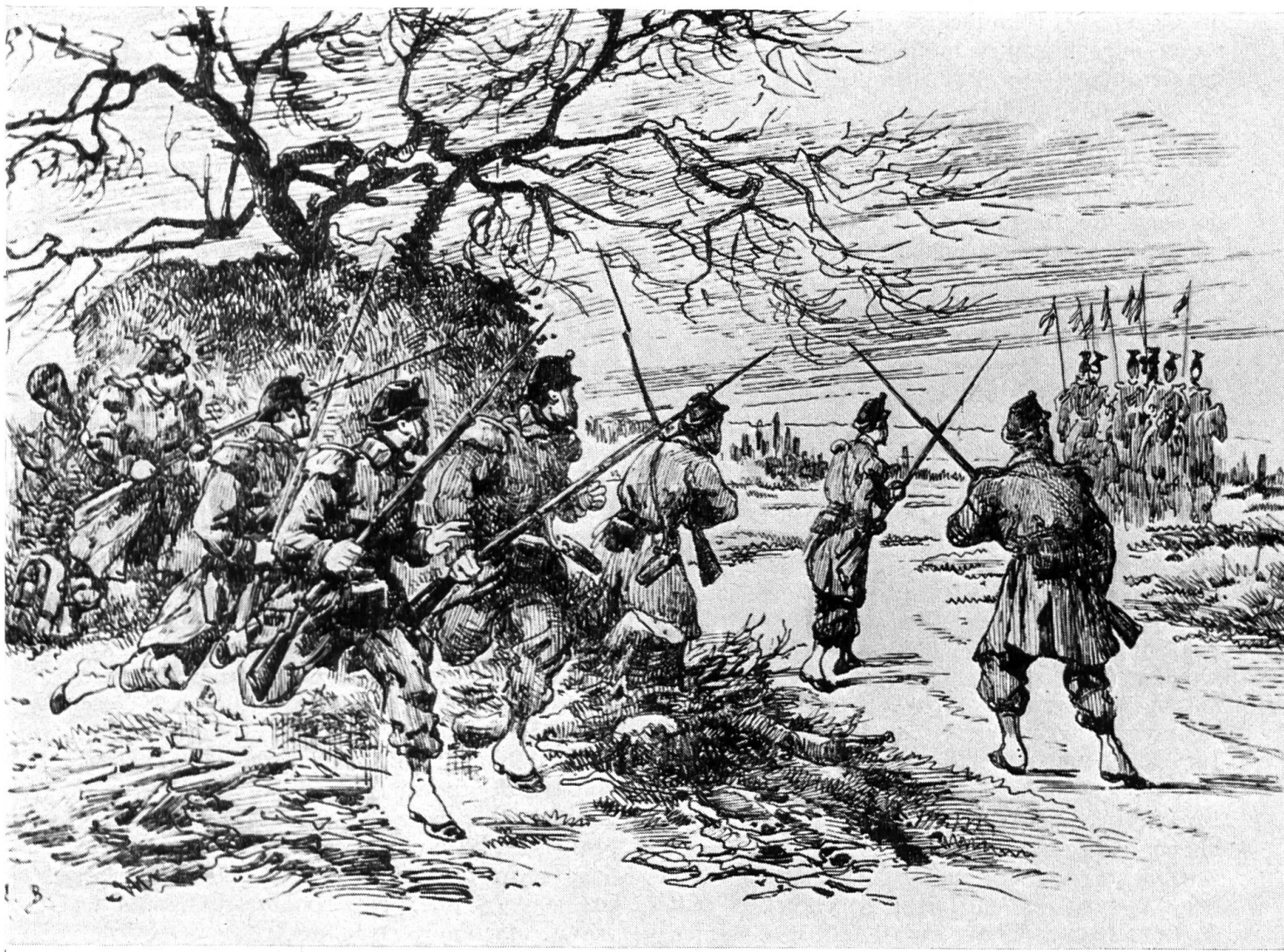
Les Uhlans, Les Uhlans