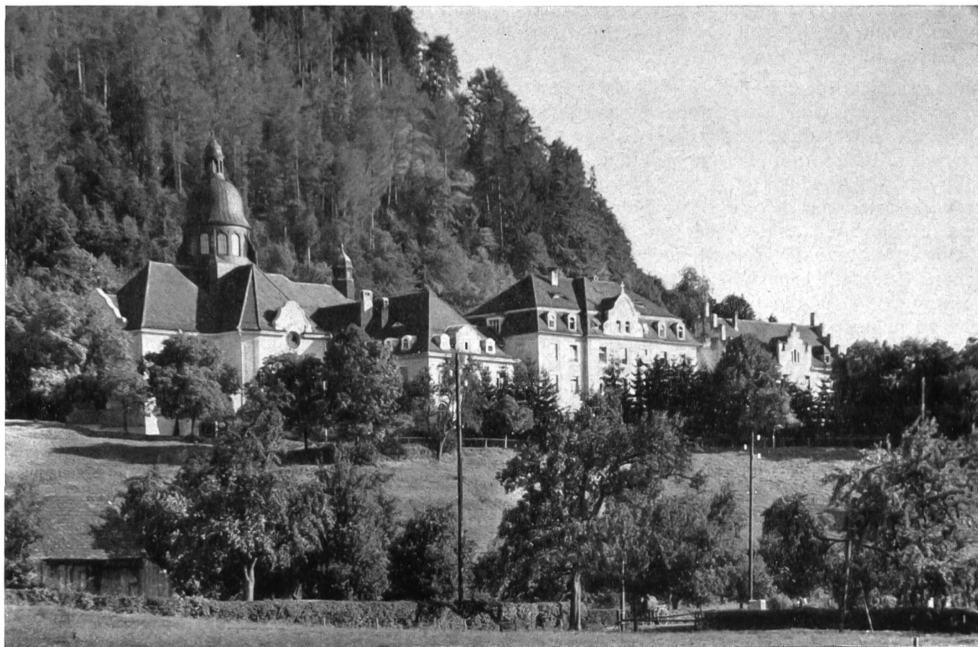
St. Gallusstift in Bregenz/Vorarlberg