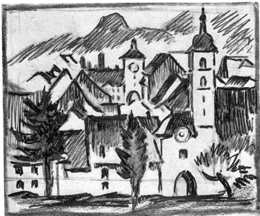
Laufen, Blick von den «Reben» von A. Cueni

satorisch und wandertechnisch. Darf man sich denn Sorgen machen, wenn es zur Mutter geht, auch wenn die Familie, die Verantwortung und die Aufgabe grösser wird?